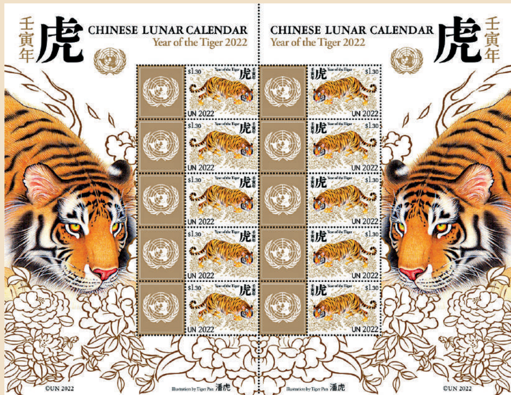
▲聯合國發行的虎年生肖郵票。