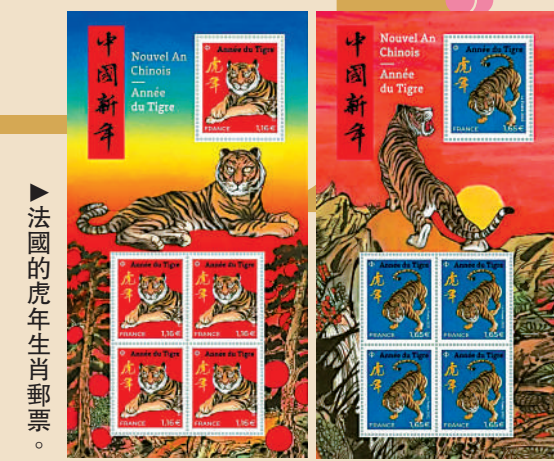
▲法國的虎年生肖郵票。

聯合國郵政管理局在2010年5月首次發行以中國生肖為內容的郵票，今年的虎年郵票恰好開啟了第二輪生肖郵票的發行。