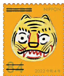
▲日本和韓國的虎年生肖郵票。

生肖郵票。全球第一枚生肖郵票為日本於1950年虎年生肖郵票，圖案為日本著名畫家圓山應舉名畫《龍虎圖》（見圖），目前有價無市。中國內地首次發行生肖郵票是自1980年農曆猴年，中國香港地區的首輪生肖郵票在1967年農曆羊年發行。