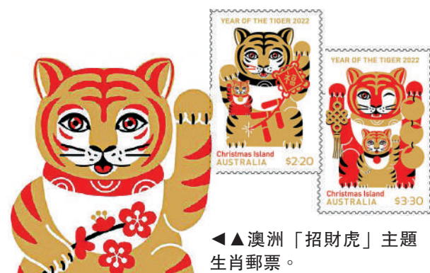
▲澳洲「招財虎」主題生肖郵票。