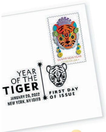
▲美國郵政的虎年生肖郵票及首日封。

美國郵政總局2022年1月20日正式發行虎年郵票，小全張總計郵票數20枚。郵票根據插畫家Camille Chew的原畫設計製作而成，除了參考舞龍和舞獅形象，也有中國民間剪紙工藝的現代詮釋，節日的喜慶氣氛濃厚。發行農曆新年郵票是美國郵政的傳統，1998年第一枚虎年郵票為藍底黃橙相間的剪紙老虎；2010年的虎年郵票是寓意喜慶的水仙花。