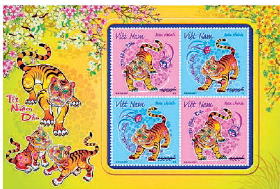
▲越南的虎年生肖郵票。

新加坡郵政在2022年1月7日開始發行虎年限量版生肖郵票，由新加坡本地插畫家林願玲設計，用插畫形式表現了活潑的老虎家族，包含第一級本地郵資和1元4角兩種面值。這是新加坡自1996年發行生肖郵票以來，第三輪生肖郵票的第三套。泰國的虎年生肖郵票延續從2015年起的傳統，由泰國詩琳通公主親手繪製，卡通圖案趣味十足。越南發行虎年生肖郵票2種，小版張1枚，畫面為老虎戲繡球。