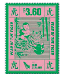
▲新西蘭的年畫主題虎年郵票。