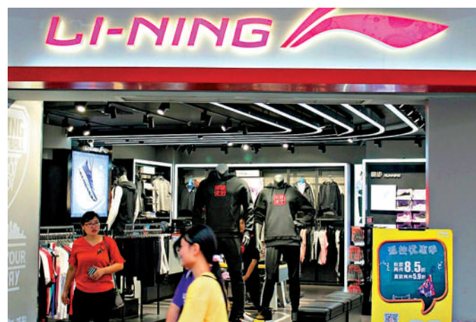
▲受惠北京冬奧開幕，李寧等體育用品股獲資金追捧。

除了體育用品股外，餐飲股海底撈(06862)漲8%，啤酒股百威亞太(01876)和潤啤(00291)均升逾5%，分別收報18.16元、21.6元及61.05元。