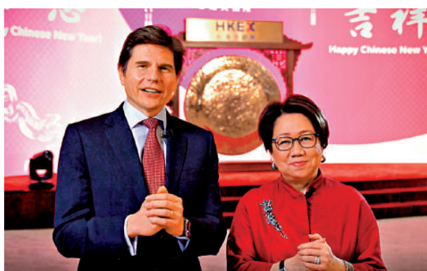
▲史美倫(右)及歐冠昇以視像形式主持港交所新春開市儀式。

角色。港交所身負的獨特使命早已超出本身業務，要為社會各界共創繁榮，將會堅定專注持續促進中國與全球的雙向資本流動，同時把握塑造香港市場及社會格局大趨勢帶來的機遇。