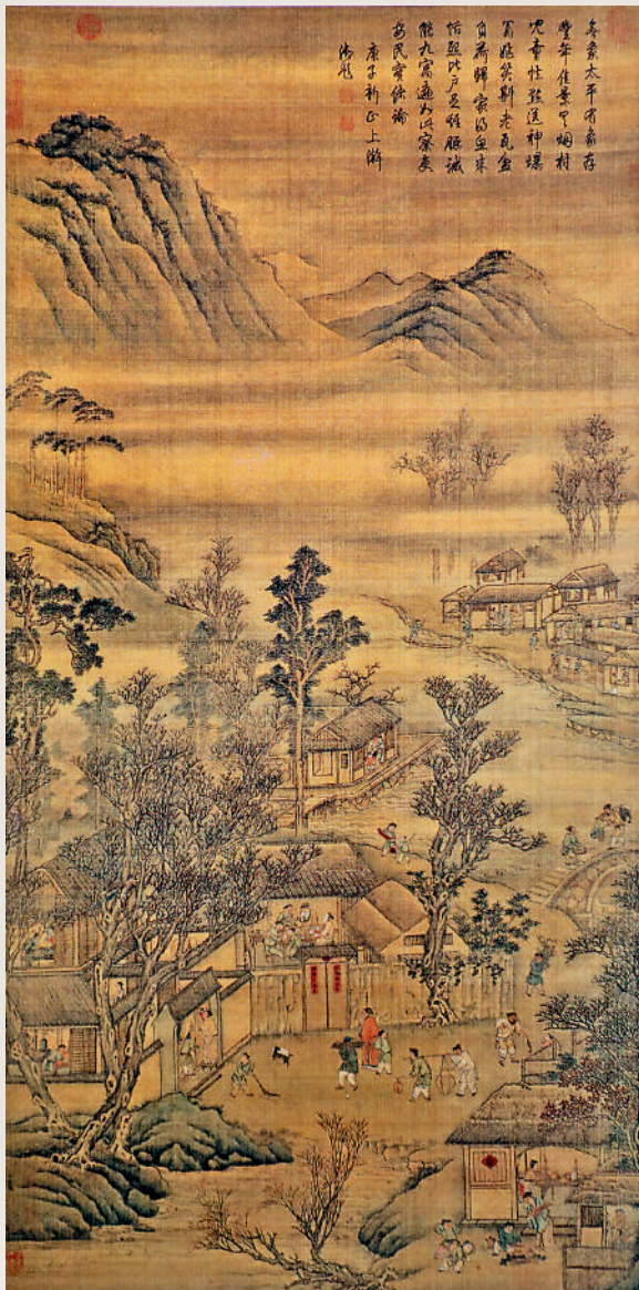
▲明佚名《豐年家慶圖》軸。故宮博物院