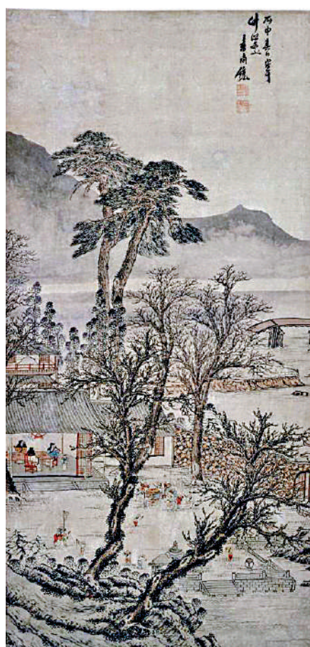
▲明袁尚統《歲朝圖》軸。故宮博物院

美術界傾向認為，現藏故宮博物院南宋李嵩《花籃圖》頁，其實就是歲朝清供圖。此畫絹本，設色。畫幅雖然不大，但是描繪細膩具體，線條富有表現力，敷色艷麗雅緻。竹籃編織精巧，籃中放滿秋葵、梔子、百合、廣玉蘭、石榴等各色鮮花，濃香洋溢，生機勃勃，採擷天地間英華奉作一年的美好祝福。如今包括香港在內的嶺南民間，過年置辦盆花、福橘以寓意花開富貴的習俗，應該就是宋明古風的餘緒。