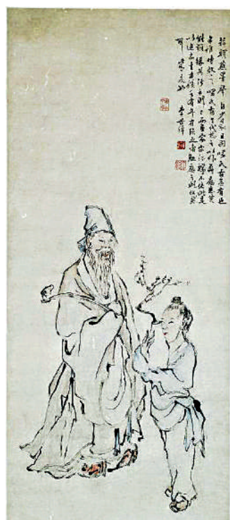
▲明李世倬《指畫歲朝圖》軸。故宮博物院

遍如此，察吏安民實緒論。」明代皇帝實行的是與內閣分權共治的皇權有限責任制，清代皇帝實行皇權無限責任制，所以政務特別繁忙。