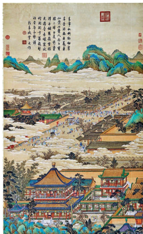
▲清宮舊藏清丁觀鵬《太簇始和圖》軸，台北故宮博物院藏。

從順治帝開始的清帝皇帝，對江南文化情有獨鍾，乾隆皇帝對江南尤其心馳神往，除六下江南，還在宮中、西苑、西郊三山五園、承德避暑山莊等地大量仿建江南園林，連御膳房都用揚州廚師。李士達《歲朝村慶圖》、佚名《豐年家慶圖》兩張明畫都是清宮舊藏，每到辭舊迎新之際，乾隆帝就展玩這些畫作。乾隆四十一年（丙申，一七七六年），「丙申歲朝明窗御題」於《歲朝村慶圖》上方：「東郭遠西墅，山家接水村。春朝慶老幼，豐歲足豚豚。三代遺風在，一時深意存。治民無別術，饑飽俾溫溫。」乾隆四十五年（庚子，一七八〇年），「庚子新正上澣御題」於《豐年家慶圖》上方：「氣象太平有象存，豐年佳景寫煙村。兒童怯點送神爆，翁媪笑對老瓦盆。負荷歸家得魚米，恬熙比戶足雞豚。誠能九寓