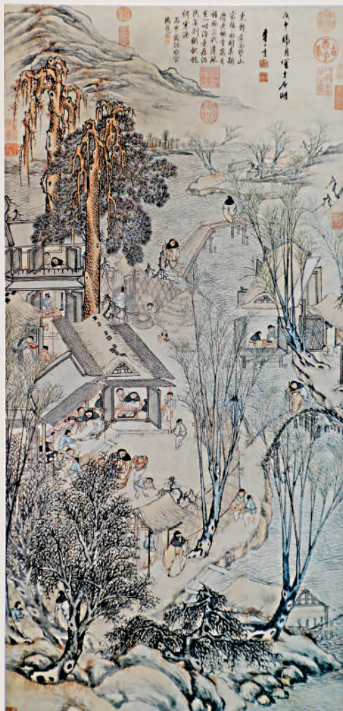
▲明李士達《歲朝村慶圖》軸。故宮博物院