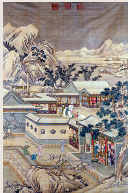
▲清郎世寧等繪《乾隆帝上元行樂圖》軸。故宮博物院