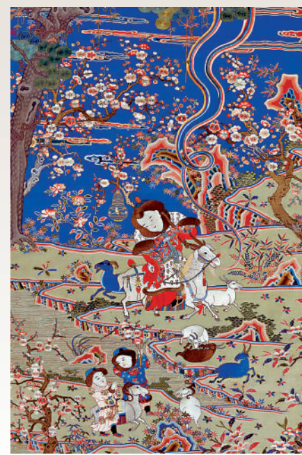
▲清乾隆《緙絲加繡九陽消寒圖》軸。

是清順治十三年（一六五六年）八十七歲客居此地時作。圖繪山村一隅，諸多孩童在院中敲鑼打鼓、放鞭炮，嬉戲玩樂，屋內三位長者同桌對飲，眼看着孩子們嬉耍，露出幸福的笑容。此圖無論建築還是傢具，都比《歲朝村慶圖》《豐年家慶圖》的高級，人物雖少一些，但喜慶氣氛相同。