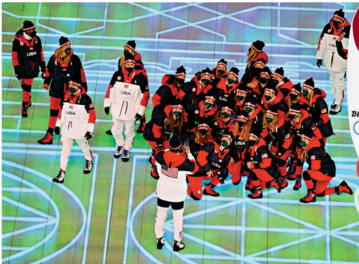
▲北京冬奧會開幕式4日晚舉行，美國代表隊成員入場後合影留念。