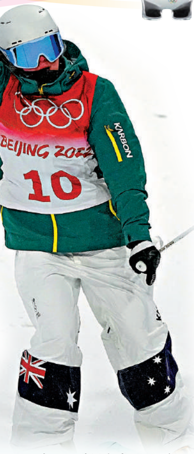
▲澳洲運動員考克斯3日在張家口雲頂滑雪公園參加技巧資格賽。

談及於4日晚舉行的北京冬奧會開幕式，澳洲自由式滑雪上技巧名將布里特妮·考克斯說：「我曾經觀看過2008年北京奧運會的開幕式，所以我對此次冬奧會的開幕式有很高的期望。」她對北京冬奧會的籌辦工作讚不絕口。「我很高興能來參加北京冬奧會，並完成自己的首場比賽。這裏的一切都很漂亮，我為中國和北京冬奧組委會做了如此出色的辦賽工作而感到驕傲。」