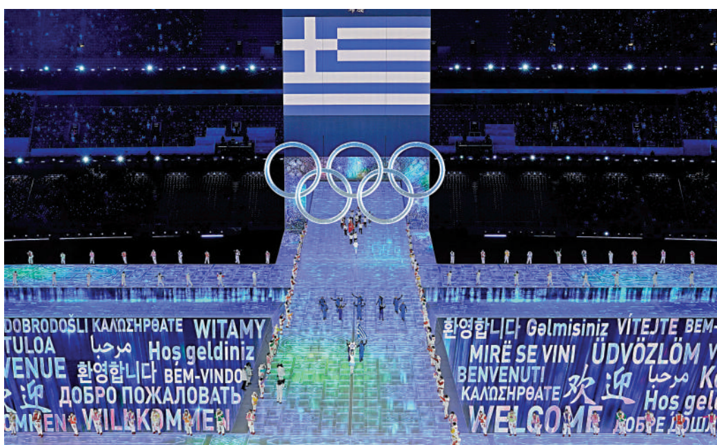
▲希臘代表隊4日晚率先進入「鳥巢」。