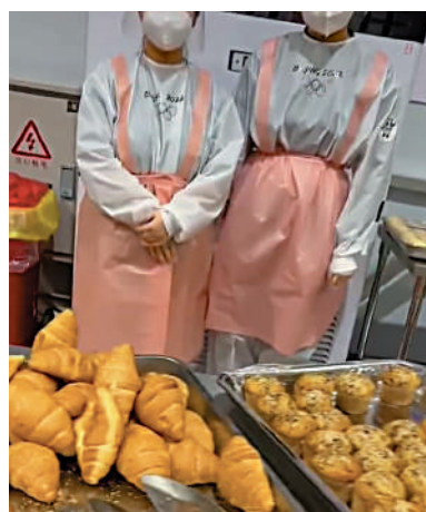
▲懷特在社交媒體上分享冬奧村餐廳食物。視頻截圖