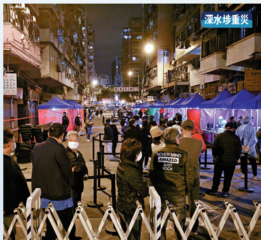
▲深水埗成源頭不明重災區，昨日有多達10人確診，鴨寮街107至131號被圍封，居民須於限期內接受檢測。

徐樂堅表示，社區現存在很多隱形傳播鏈，要全數找到源頭並不容易，圍堵策略須繼續，以確保本港醫療體系不會因陽性個案大增而崩潰，並讓當局可致力提升接種率。