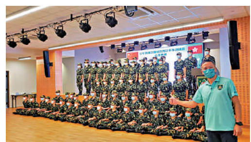
▲姚柏良十分關注青少年的發展，他是香港青少年軍總會諮詢委員會委員。

去年12月，姚柏良當選成為第七屆立法會議員。記者問他感受是否不一樣，他說，「區議員與立法會議員都為市民服務，但區議員的責任是為街坊排憂解難，立法會議員要監督政府施政，推動政府推出好的政策，令市民安居樂業」。對於未來四年，他心裏早有規劃與目標，除謙卑的心態，用心聆聽各方意見外，還要更宏觀地看待旅業發展、更具體地梳理問題、更貼地地為業界做實事，為旅遊業和香港的未來努力。