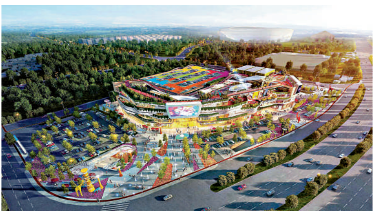
▲惠州印象城匯集運動健康、居家生活、兒童主題、休閒娛樂和美食天地五大業態。