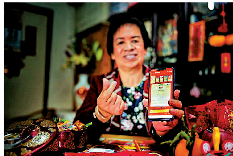
▲AlipayHK為用戶準備了多款新春限定紅包封面。