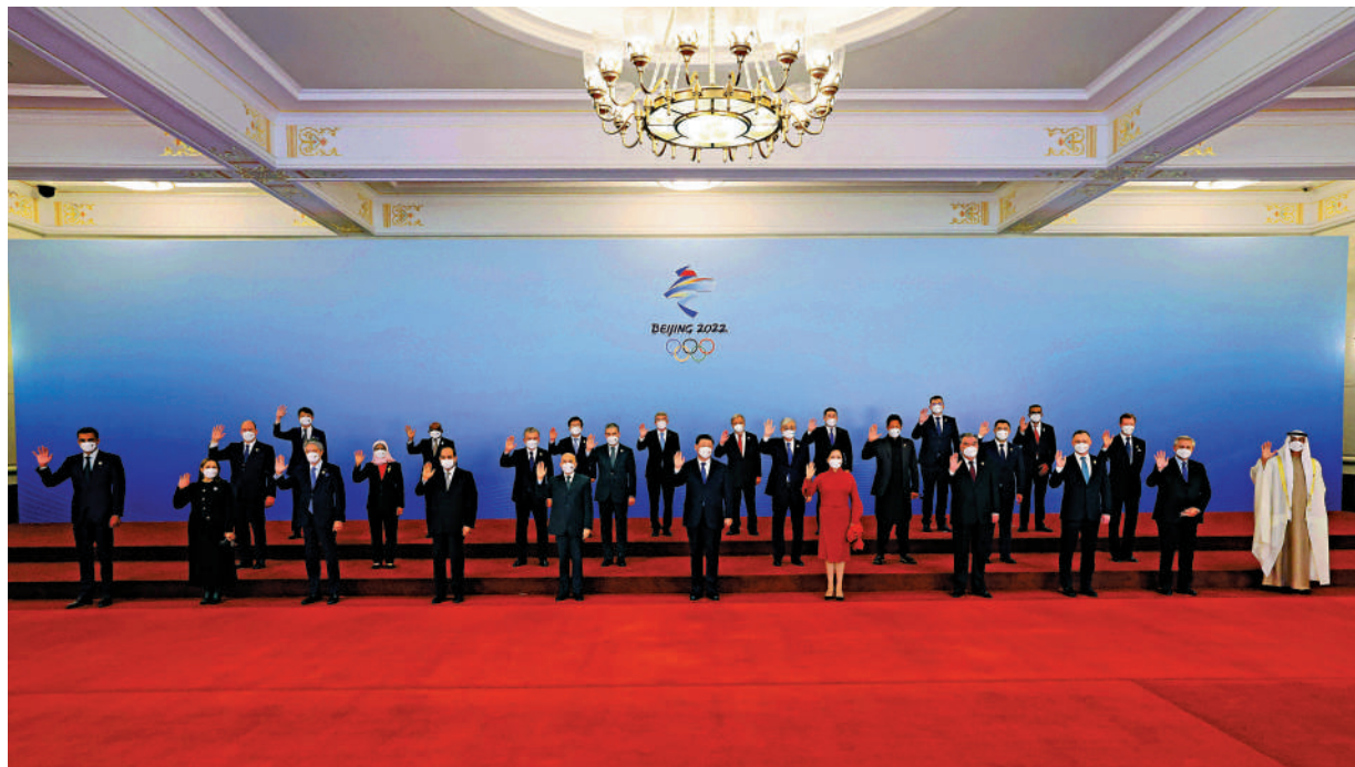
▲ 2月5日中午，中國國家主席習近平和夫人彭麗媛在北京人民大會堂金色大廳舉行宴會，歡迎出席北京2022年冬奧會開幕式的國際貴賓。這是習近平和彭麗媛同國際貴賓一起合影留念。