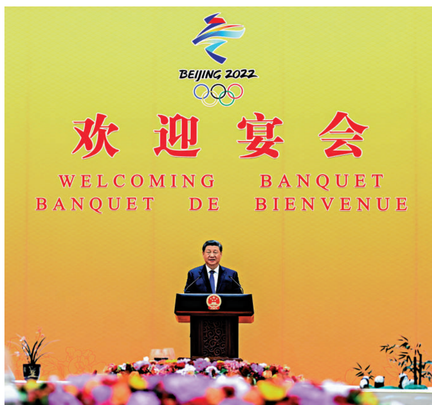
▲5日中午，中國國家主席習近平和夫人彭麗媛在北京人民大會堂金色大廳舉行宴會，歡迎出席北京2022年冬奧會開幕式的國際貴賓。這是習近平在宴會上發表致辭。

新冠肺炎疫情延宕反覆，全球性挑戰層出不窮……正如聯合國秘書長古特雷斯所言，當前，世界需要一屆成功的冬奧會，向世人發出明確信息，即任何國家、民族的人民都可以超越分歧，實現團結與合作。