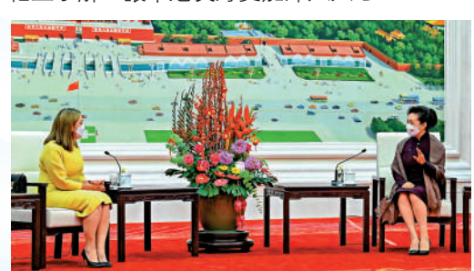
▲5日，中國國家主席習近平夫人彭麗媛在京會見厄瓜多爾總統夫人阿爾西瓦。

不同文化。中厄兩國都有深厚的文化底蘊，雙方可以深入開展人文交流合作，增進兩國人民相互了解，讓中厄友好更加深入人心。