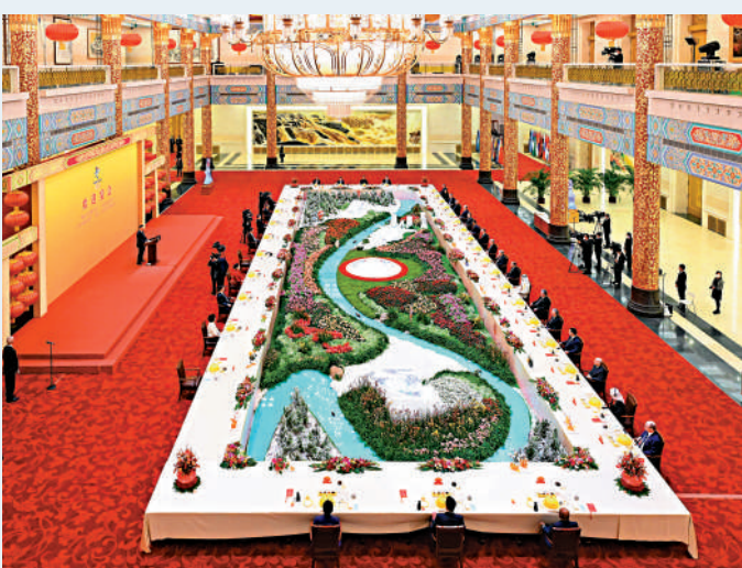
▲5日中午，習近平和夫人彭麗媛在北京人民大會堂金色大廳舉行宴會。