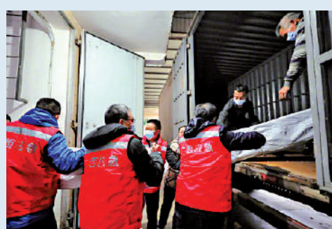
▲工作人員正在搬運送往百色的應急物資。

受疫情影響，2月7日，中國鐵路南寧局集團有限公司調整14趟百色站始發或終到動車運行區段，安排南寧至百色D9665次等11趟動車停運，安排南寧至靖西間6趟普速客車停運，途經百色市轄區內火車站的旅客列車不辦理旅客上下車業務。記者了解到，南寧局集團公司對百色市轄區內百色、田陽、田東、平果、德保、靖西、田林火車站暫停辦理客運業務，具體恢復日期根據百色疫情防控情況另行通告。大公報記者 曾萍