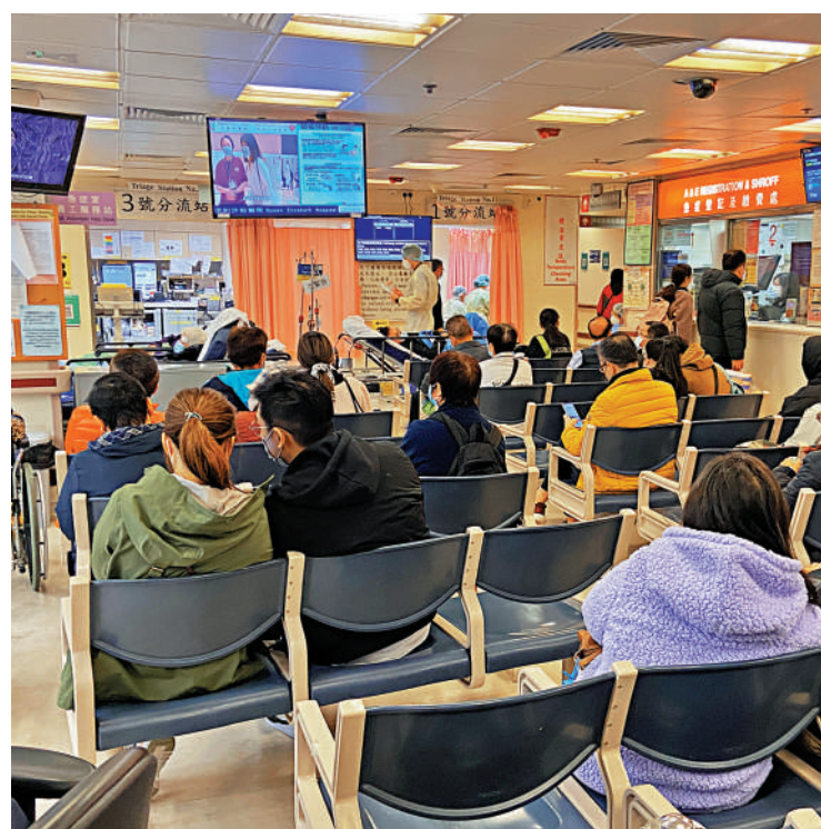
▲伊利沙伯醫院急症室內擠滿等待診症的病人，專家認為，陽性患者出門往急症室，有機會感染交通工具上的乘客，以及急症室內其他病人。