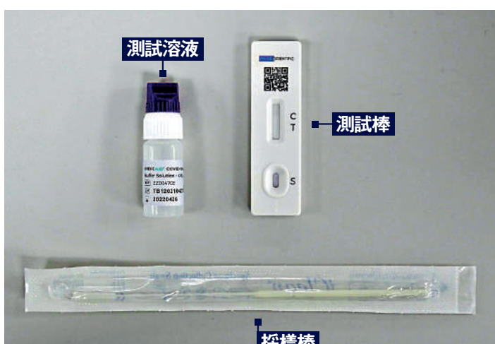
▲市面上其中一款新冠病毒快速抗原測試套裝。