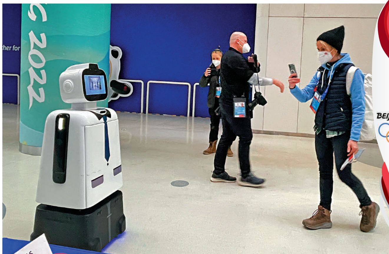
▲國產機械人「笨小寶」在「冰立方」內提供優質服務，中外人士點讚不絕。

在漢特雲公司，大公報記者看到除「笨小寶」外，笨笨家族還有消毒、快遞、垃圾分類回收等功能的四款服務機器人。漢特雲核心技術團隊原來都是汽車高速自動駕駛領域的專家，2019年才轉身做服務機器人。「機器人的底盤都是我們自己研發製作的，我們把核心的底盤跟自動駕駛能力構建好後，每一款底盤都可以實