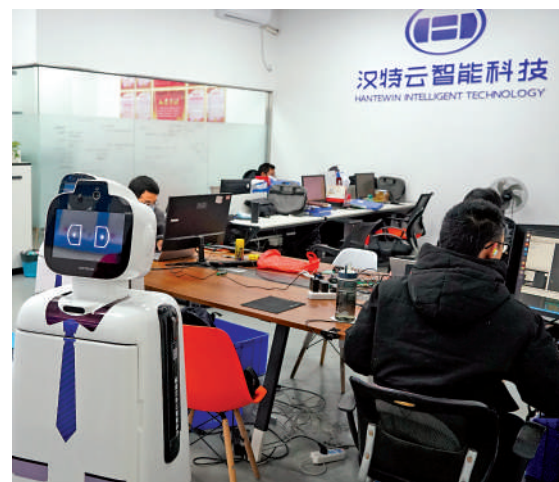
▲工程師正在寫代碼。