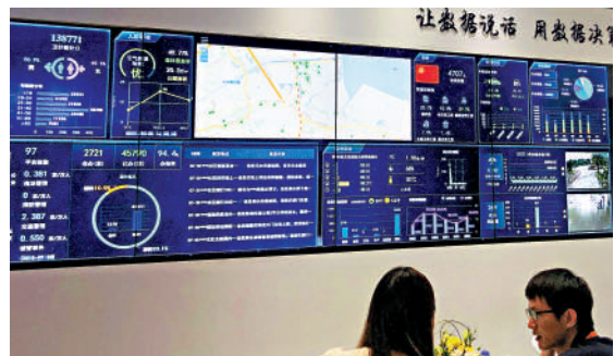
▲珠海智慧城市系統信息量豐富。

【大公報訊】記者方俊明珠海報道：記者8日從珠海市政府獲悉，珠海市政府常務會近日審議並原則通過《珠海市數字政府改革建設「十四五」規劃》（下稱《規劃》）。《規劃》對探索珠澳發展路徑、助推「一網聯通」作出相關部署；到2025年，100%實現高頻政務服務事項