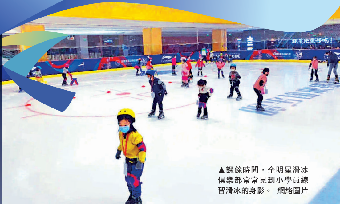
▲課餘時間，全明星滑冰俱樂部常見到小學員練習滑冰的身影。

「我與香港冰場的同行都很熟悉，和他們交流時注意到，香港的教練中職業運動員出身的並不多，這與內地情況不一樣，內地有大量國家隊、省隊退役的運動員退役後轉而在俱樂部執教鞭。」王睿對大公報指出，香港要在競技層面取得突破，應該多引進一些專業人才，這樣冰雪運動愛好者將能獲得更專業的技術指導，引進的「伯樂」也能甄選更多「千里馬」，幫助香港儲備冰雪運動人才。