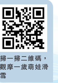
掃一掃二維碼，觀摩一歲萌娃滑雪