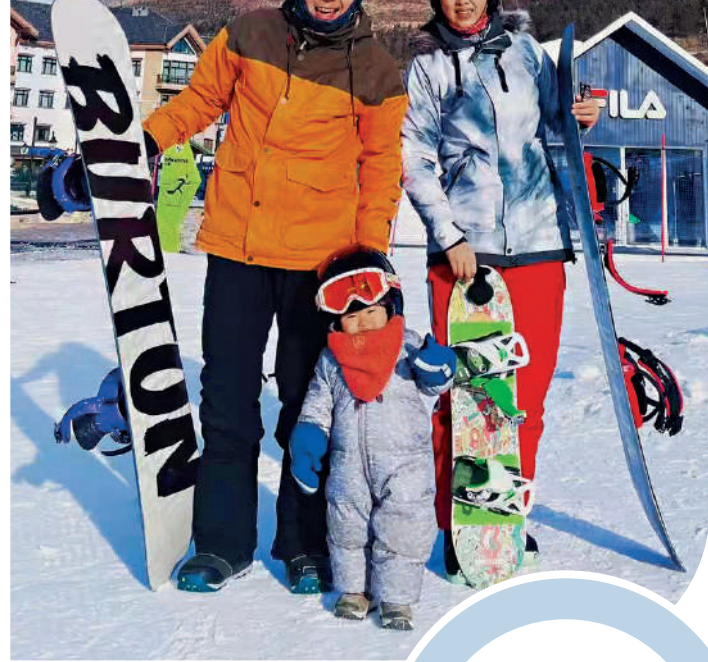
貝貝和爸爸媽媽在雪場合影。