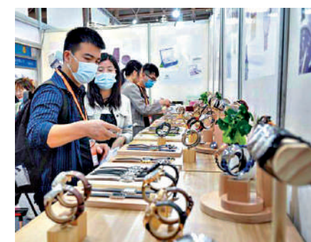
▲跨境電商促進外貿轉型升級。圖為採購商在福州首屆中國跨境電商交易會上的3C產品展位前了解商品。

目前，廣東實現跨境電商綜試區在全省21個地級以上市的全覆蓋，標誌着廣東外貿發展進入一個新的發展階段。