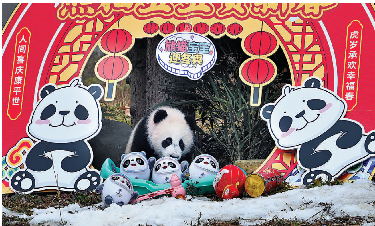
▲在四川臥龍神樹坪基地，半歲左右的大熊貓寶實和冬奧會吉祥物「冰墩墩」和「雪容融」互動。