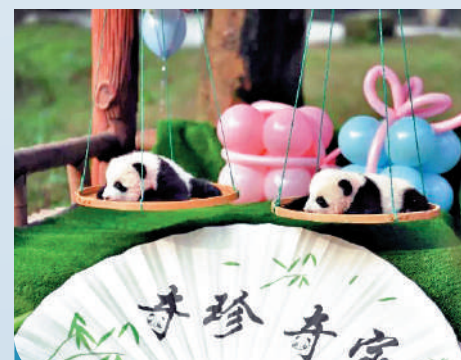
▲1月22日，在黑龍江省尚志市的中國亞布力熊貓館裏，大熊貓在熊貓館室外場館活動。