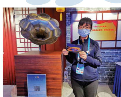
▲2022北京新聞中心裏可以把「聲音」打印出來郵寄的明信片。大公報記者張帥攝

拿到明信片後，掃描上面的二維碼，就能反覆收聽已選定的音效。這種明信片和音效的隨機組合，讓每張明信片都成為介紹北京和冬奧的「名片」，吸引了眾多境內外媒體記者的興趣而駐足。據2022北京新聞中心志願者介紹，不少境外記者還會湊齊整套明信片，寫上寄語，蓋上2022北京新聞中心印章留作北京冬奧的紀念。大公報記者 張帥