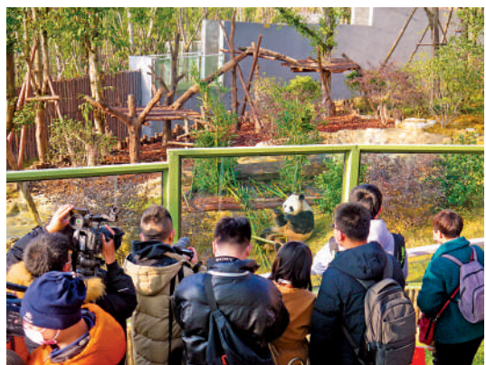
▲在成都大熊貓繁育研究基地，遊客可以隔着玻璃和大熊貓「親密接觸」。