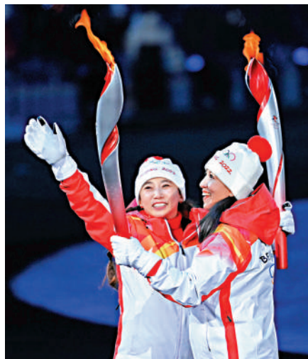
▲奧運聖火,照亮大家光明的前路,也傳遞出環保的理念。

2022冬季奧運會開幕式以「構建人類命運共同體」為核心表達,以「簡約、安全、精彩」為原則,處處展現了中國人的浪漫。選用中國獨有的24氣節作為倒計時,冬奧會於2月4日開幕,也是第24屆奧運會,儀式開幕是20:04,中國隊正是24分出場。隨後「孩子」吹散了蒲公英,當白色的種子飛向天空,天空出現「蒲公英」的焰火。空中同時出現了「spring和立春」將中國文化與西方文化一同