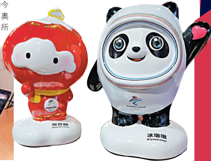
▲吉祥物冰墩墩和雪容融,意喻敦厚、健康、活潑和可愛。