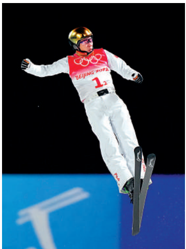
中國隊選手賈宗洋在比賽中。