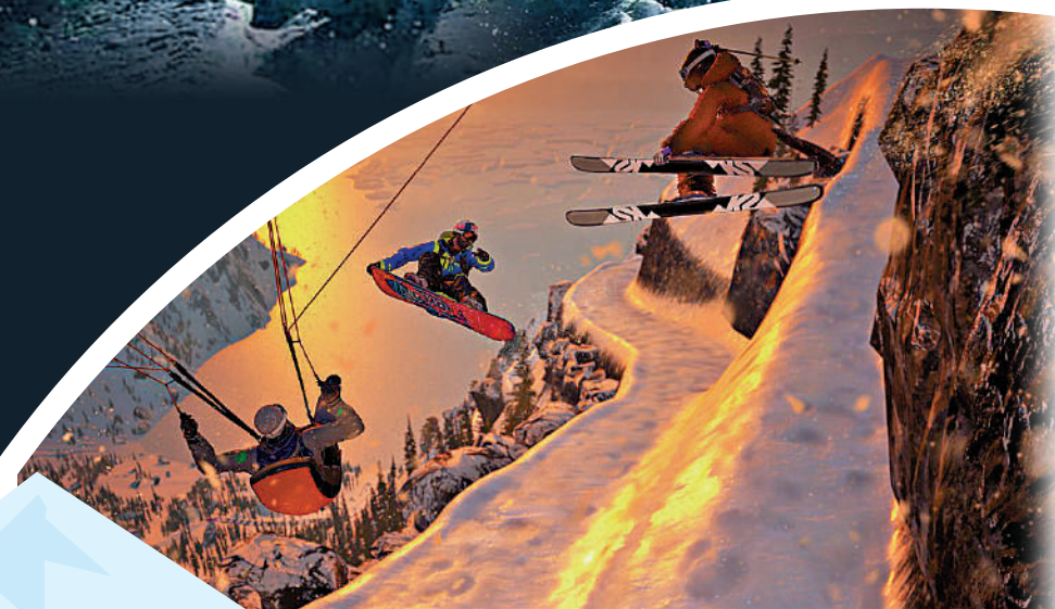
◀玩家可在德納利山場景裏施展滑雪技巧。