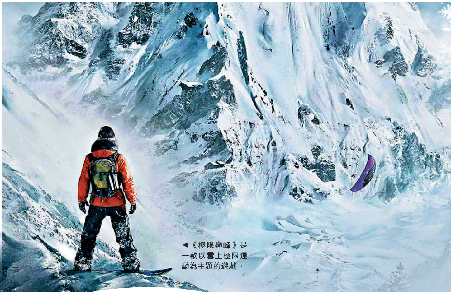
◀《極限巔峰》是一款以雪上極限運動為主題的遊戲。

伴着濃濃的年味與可愛的「冰墩墩」，北京冬奧會熱烈進行中。但因為疫情，包括筆者在內的許多人無法赴北京現場觀看冬奧會，除了電視觀看奧運會外，或許還能通過遊戲的方式，更立體地體驗冰雪的樂趣。本期「3C科技」就讓我們一同盤點那些與冰雪相關的遊戲作品。