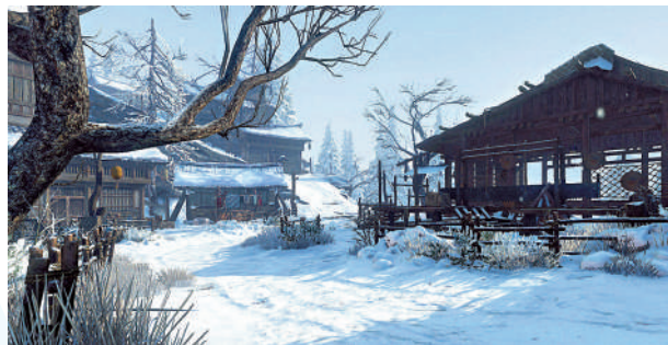
▲《逆水寒》裏的江南雪景。