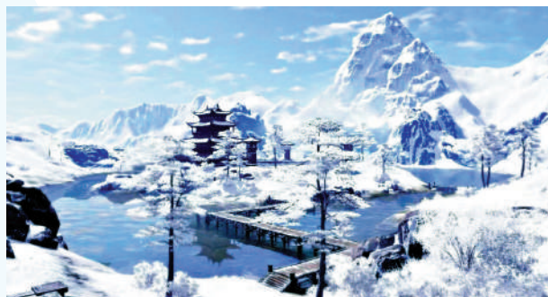
▲《天涯明月刀》遊戲裏的雪景頗為壯觀。