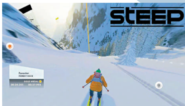
▲《極限巔峰》遊戲界面。