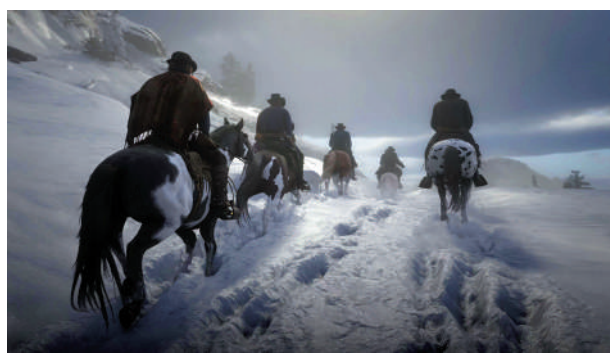
▲策馬奔馳在西部雪原，是《Red Dead Redemption 2》的鐵血浪漫。