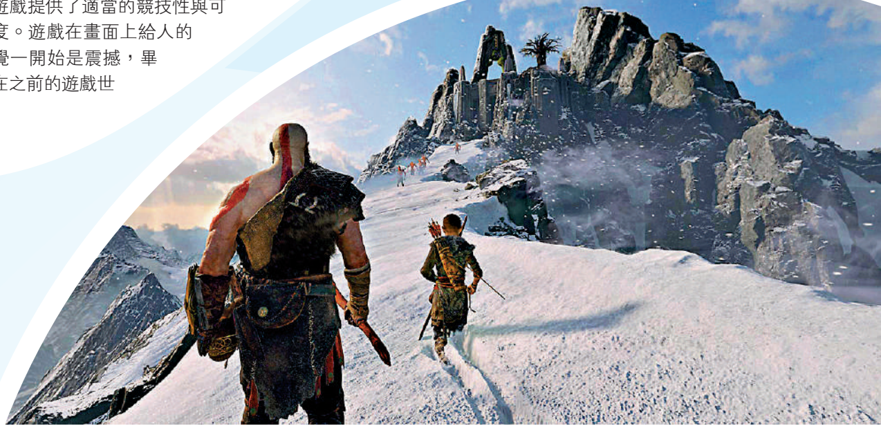
▲《戰神4》中的雪景讓玩家印象深刻。

儘管現在冰雪運動為主題的遊戲大作還鮮少面世，但相信隨着冬奧的影響與冰雪運動市場的擴大，更多精彩的冰雪主題遊戲將會與玩家们相見。