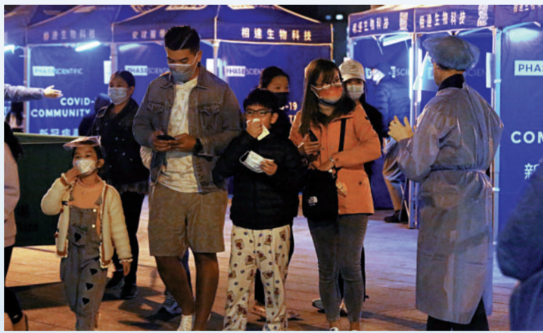
▲水泉澳邨茂泉樓污水樣本對新冠病毒呈陽性，昨晚被圍封，居民排隊領取物資。

衛生防護中心總監徐樂堅表示，疫情快速發展，料確診個案量在未來短時間內會持續高企。現時的