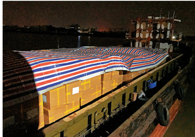
◀滿載防疫物資的船隻連夜從廣東開往香港。