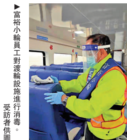
▲富裕小輪員工對渡輪設施進行消毒。

【大公報訊】記者盧靜怡廣州報道：香港第五波疫情爆發以來，作為香港本地水上交通的重要運營方，珠