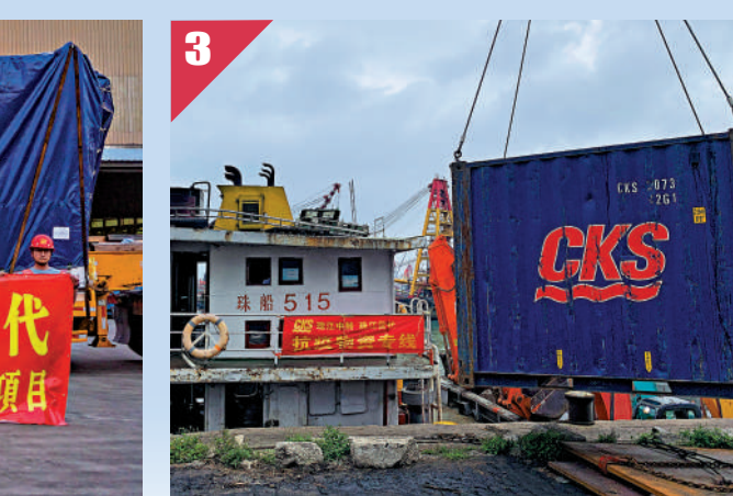
▲2月8日，滿載着東南亞進口木材的班列，從南沙港開往江門。網絡圖片

起，珠江中轉就積極參與香港防疫隔離屋運輸項目，助力香港防疫中心建設，截至目前已經完成運輸組裝式隔離板房共266個。據透露，這266個隔離板房所用到的材料、水泥預製件之類的配件超過2.5萬件，總重量超2萬噸。