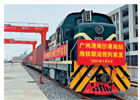
▲2月8日，滿載着東南亞進口木材的班列，從南沙港開往江門。

江門北站位於江門鶴山市「珠西國際物流中心」，是廣珠鐵路與南沙疏港線交匯形成聯接高欄港與南沙港的物流樞紐節點。江門北站已經相繼開通深圳