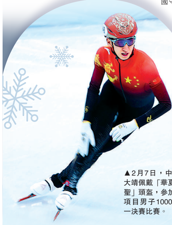
▲2月7日，中國選手武大靖佩戴「華夏戰神孫大聖」頭盔，參加短道速滑項目男子1000米四分之一決賽比賽。

中國短道速滑隊在冬奧會上摘金攬銀，選手們充滿中國風的頭盔同樣引人注目，而且這些頭盔還都有專屬的名字。武大靖所