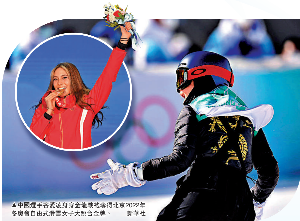
▲中國選手谷愛凌身穿金龍戰袍奪得北京2022年冬奧會自由式滑雪女子大跳台金牌。