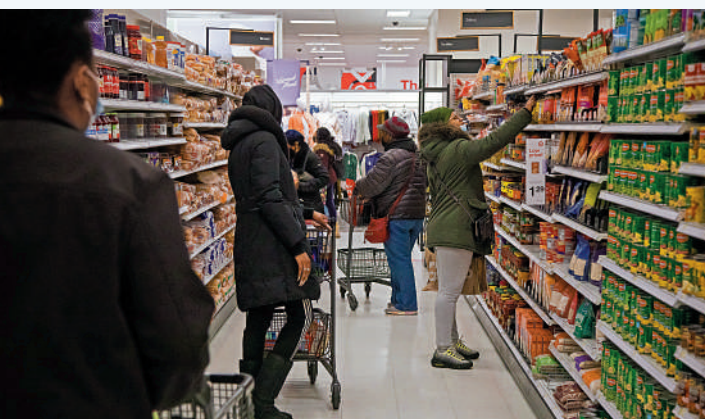
▲10日，顧客在美國紐約一間超市購物。

●2018年，美英法等國炒作「敘利亞政府軍對人民使用化學武器」的視頻，對敘利亞發動空襲，造成成千上萬無辜平民傷亡、流離失所。 ●但所謂證據後被揭露是美英情報部門資助的敘利亞民防組織「白頭盔」自導自演的擺拍影片。大公報整理