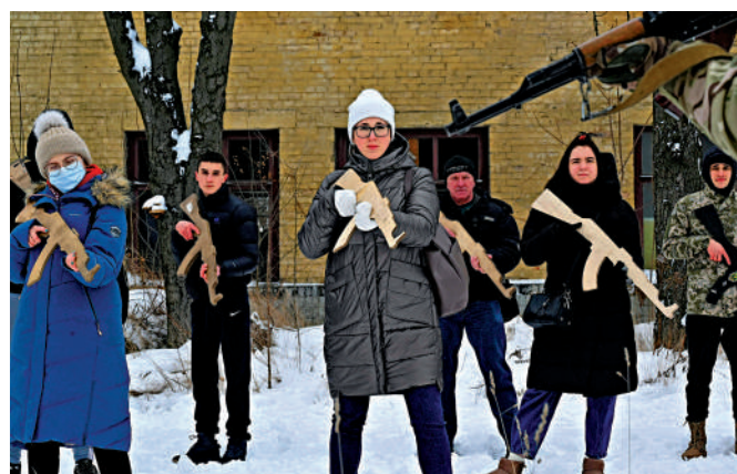
▶1月底，一批烏克蘭平民持木槍訓練。