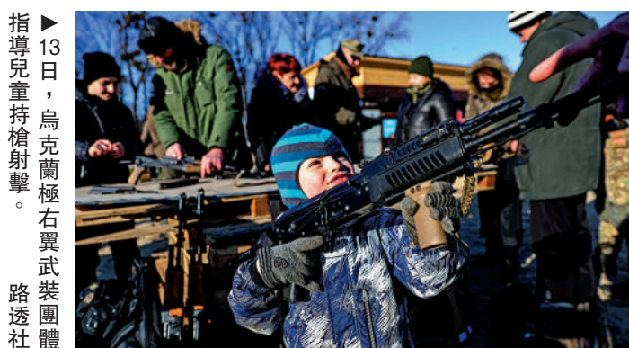
▶13日，烏克蘭極右翼武裝團體指導兒童持槍射擊。

不過，西方媒體在「亞速營」訓練平民的報道上裝聾作啞，刻意無視衣着和物品上的納粹標誌，美國廣播