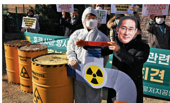
▲1月6日，韓國示威者抗議日本政府堅持將核污水排入海。

2011年「3·11」大地震導致福島第一核電站堆芯熔毀、放射性物質外洩，持續冷卻堆芯的作業以及雨