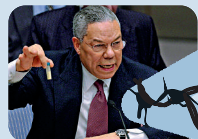
▲2003年2月，時任美國國務卿鮑威爾在聯合國安理會拿出一瓶白色粉末。

●2003年2月，時任美國國務卿鮑威爾在聯合國安理會拿出一個裝有白色粉末的小瓶，宣稱伊拉克擁有「大規模殺傷武器」，並藉此發動伊拉克戰爭。英國前首相理雅聖稱生化武器恐落入恐怖分子之手、威脅英國安全，支持美國出兵。