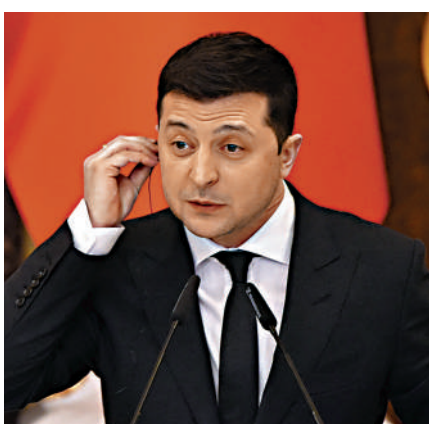
▶烏克蘭總統澤連斯基8日在記者會上發表講話。

提到本月16日俄羅斯將發動進攻。對此，烏克蘭總統澤連斯基接連淡化，更要美國提出何以是16日的證據。目前的烏克蘭局勢成了美英不斷拱火，