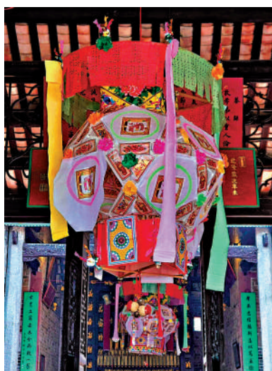
▲邱國光表示，家長要學會利用生活點滴，激發孩子對國史的興趣。圖為中國傳統花燈。

邱國光表示，愛國是自然行為，不需要特意和孩子強調「愛國」等字眼，就像沒有孩子會經常對爸爸媽媽說「我愛你」。邱國光說：「香港的情況很特別，新一代年輕人要有『香港心、國家情、世界觀』，若孩子在課餘能深入認識更多中國歷史，那麼『愛國情』自然就會在他們心中萌芽。」