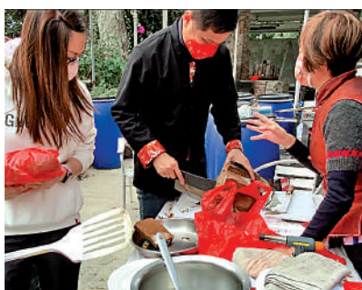
◀辛苦製作完成後，大家當然即場分甘同味。

它以其製作工具圓形的竹籠而命名，直徑闊達兩呎，製作過程需劈柴起灶，單是材料糯米已重達25斤，要多人合力來將粉漿混和，置於用蕉葉鋪好的竹籠內，以柴火連續蒸15小時，其間村民需通宵守候，再放涼七天。每逢新年，鹽田梓的原居民都喜歡回到老家團拜，一起分享此圓籠茶糕，亦會派給村民及遊客。