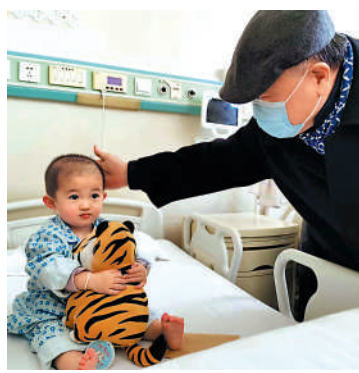
▲莫言看望患有先天性心臟病的兒童。

莫言一行來到病房，與家長們親切交流，詢問孩子們的身體情況，祝福孩子們早日康復。鼓勵他們康復以後好好學習。莫言表示：慈善是人的內心需要，也是自我價值的一種證明方式。他希望不但自己成為慈善隊伍中的一員，也希望能夠帶動身邊的人都積極投入到這份有意義的事業中來，幫助更多人感受社會的關愛。