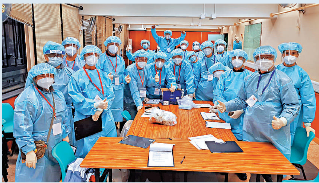
▲香港疫情嚴峻，退休紀律部隊人員全力協助抗疫，守護香港市民。

他表示，日本也曾把酒店改裝作隔離設施。改裝工作並不困難，一般以日計算，但並非所有酒店適合改裝，需視乎實際環境。有關酒店還原工程也不困難，一般數天可完成，「當酒店被用作隔離設施後，地方界定為不潔淨，除非還原為止。」