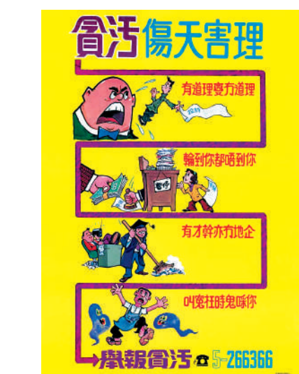
廉署一九七〇年代海報。