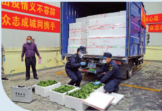
廣州海關開設供港蔬菜「綠色通道」，提供隨到隨檢、快速驗放等服務。