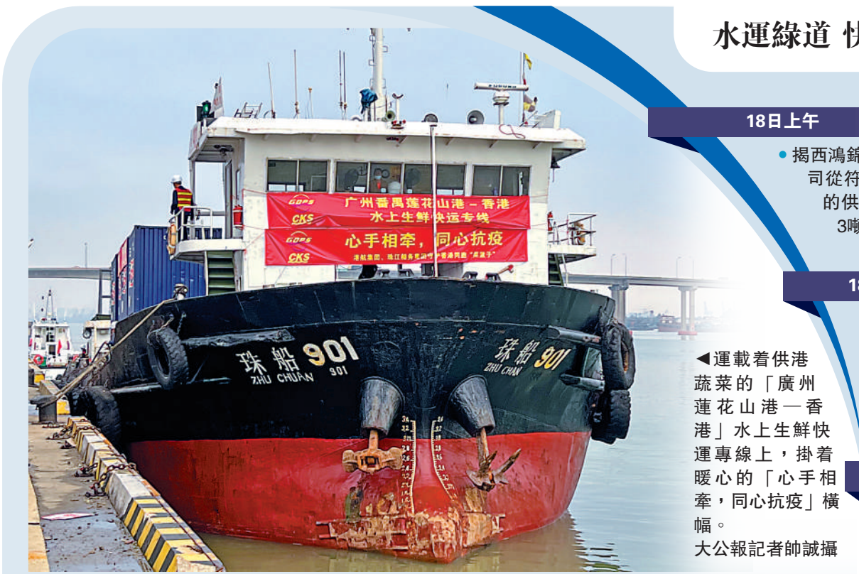
運載着供港蔬菜的「廣州蓮花山港—香港」水上生鮮快運專線上，掛着暖心的「心手相牽，同心抗疫」橫幅。

海關第一時間成立應急保障小組進行對接，對供港蔬菜進行隨到隨檢、快速驗放，嚴格把關的同時實現蔬菜從運抵到裝船『零等候』