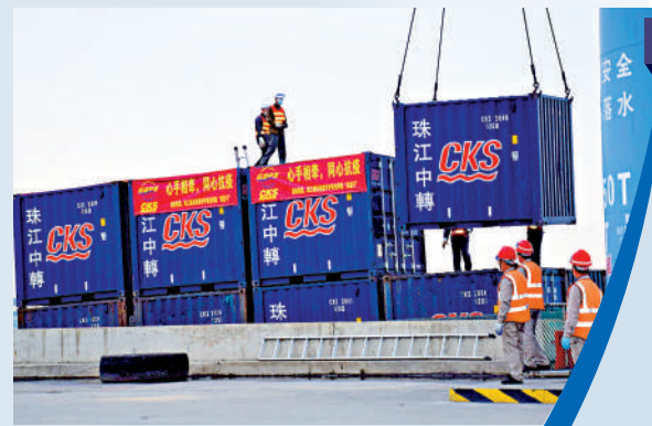
裝有供港蔬菜的貨櫃被吊上貨船。