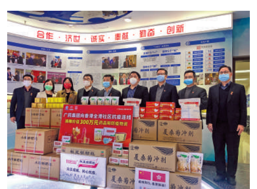
廣藥此次援港物資包括名優抗病毒中成藥以及口罩、防護服等防疫急需物品。

「疫」境，共赴光輝前程」。據悉，自新冠肺炎疫情爆發以來，廣藥作為廣東省和廣州市藥品器械和防疫物資儲備承儲單位，堅持「不提價、不停工」，加班生產抗病毒藥物，助力建立廣州市「穗康」網約口罩渠道；累計捐贈藥品、防護物資超3000萬元人民幣，累計供應各類防疫物資超1.2億件。