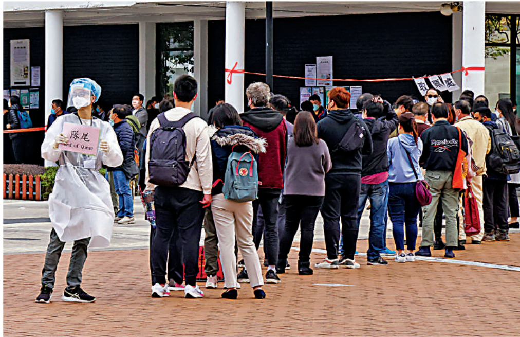
▲香港近日確診者幾何級飆升，不少市民排隊做檢測。

問到新冠康復者如何處理後遺症？張醫師說：「根據中國工程院院士鍾南山所述，康復者是否有後遺症，要視乎其患病時病情的嚴重性。長者如得了肺炎，肺部或會『花』，呼吸會比以往差。如他們及早接種新冠疫苗，不幸得了重症，後遺症也不會太嚴重。我曾治療過不少重症康復者，其中長者一般在一年後出現四肢無力、發冷、頭暈、上不到樓梯、脾胃功能及消化功能等問題。」