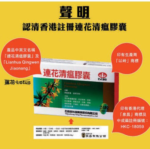
▲正版「連花清瘟膠囊」。

大公報記者昨日到深水埗、葵芳一帶的藥房了解，「連花清瘟膠囊」已賣斷市，有職員稱上星期大批市民蜂擁前來搶購，令產品一掃而空，目前還未知何時返貨，「有排都唔會有貨」。