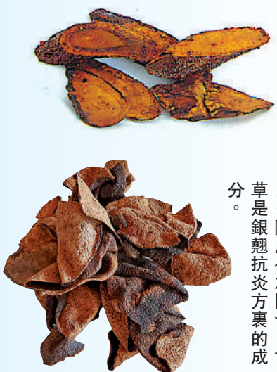
▲陳皮（左圖）、甘草是銀翹抗炎方裏的成分。