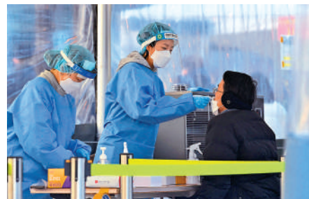
▲2月18日，醫務人員在首爾的一間檢測中心替市民進行採樣。

去年11月採取「與病毒共存」的路線後，韓國疫情處於嚴峻狀態。專家預計，本輪韓國疫情將在3月中達到頂峰，單日確診將達到27萬。