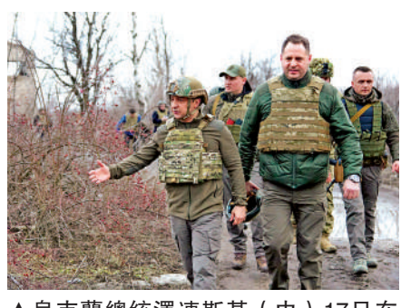
▲烏克蘭總統澤連斯基（中）17日在涅茨克地區視察前線。

拜登17日被記者問到烏克蘭局勢時聲稱，俄羅斯在未來幾天出兵烏克蘭的可能性「很高」，並指莫斯科正進行「嫁禍」行動，作為「入侵」烏克蘭的理據。布林肯同日也在聯合國安理會表示，根據美國的情報，俄羅斯軍隊正準備在未來幾天對烏克蘭發