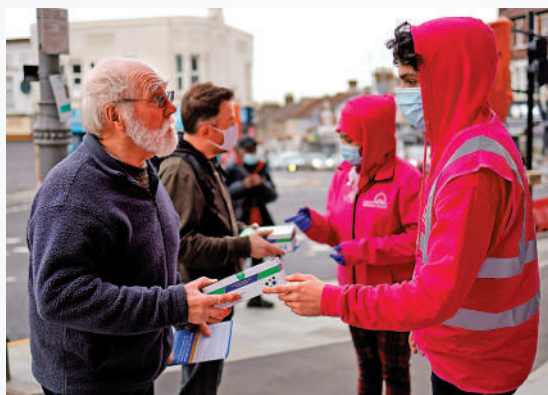
▲1月3日，倫敦的志願者向民眾派發快速檢測套裝。

這項日本研究周三發表在網絡醫學刊物bioRxiv上，尚未經過同行審查。研究作者、東京大學研究員佐藤佳認為，這些發現證明BA.2不應被視為Omicron的亞變種，應該需要對它進行更密切監測。華盛頓大學醫學院病毒學家富勒也說，有可能要給予BA.2一個新命名。