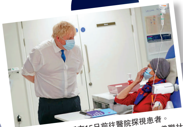
▲英國首相約翰遜在15日前往醫院探視患者。

【大公報訊】綜合英國《衛報》、《金融時報》及路透社報導：英國首相約翰遜早前宣布，計劃在本月底提前解除英國的絕大部分防疫政策，徹底與病毒共存。為此，英國國民保健署（NHS）的專家17日警告，英國不可過早放鬆防疫，並要求政府披露「與病毒共存」政策的科學依據，認為約翰遜是受政治原因驅使才做的決定。