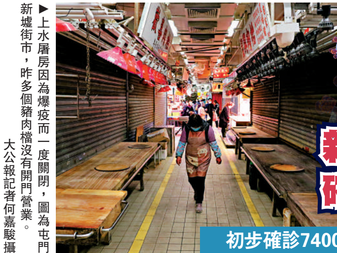
新墟街市，昨多個豬肉檔沒有開門營業。