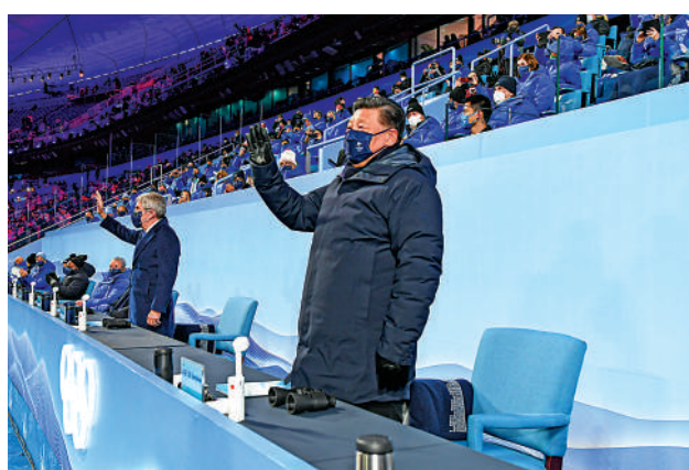
▲2月4日晚，中國國家主席習近平、國際奧委會主席巴赫出席北京第24屆冬季奧林匹克運動會開幕式。

2018年平昌冬奧會開幕式上，令人驚艷的「北京8分鐘」裏，習近平主席代表中國向世界發出冬奧之約：「我和億萬中國人民，歡迎全世界的