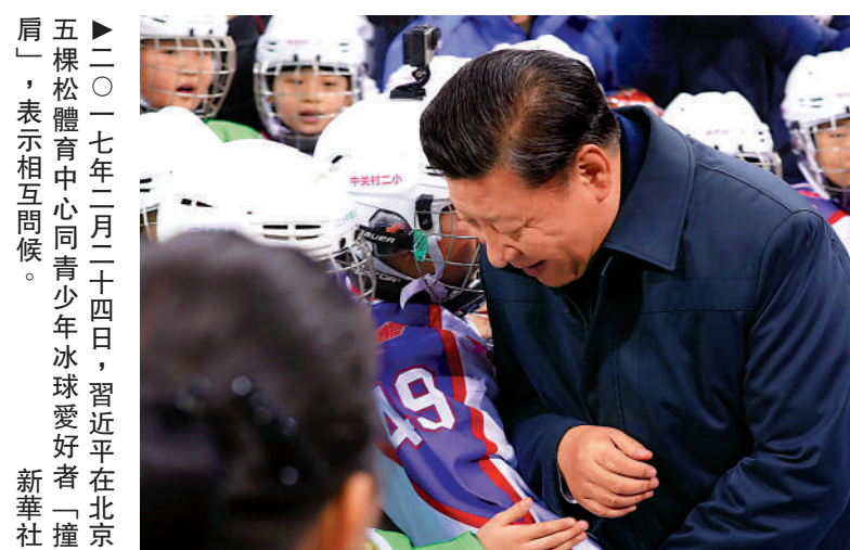
▲二〇一七年二月二十四日，習近平在北京五棵松體育中心同青少年冰球愛好者「撞肩」，表示相互問候。