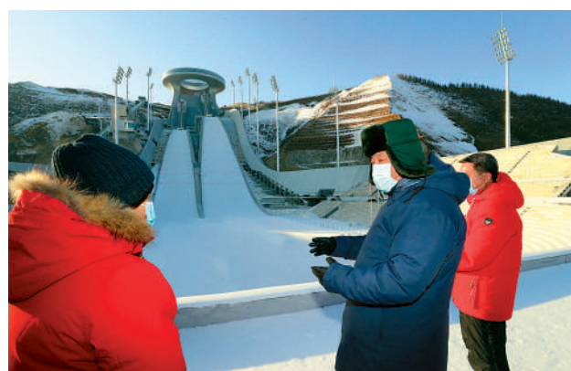
▲2021年1月19日，習近平在張家口賽區國家跳台滑雪中心考察。

他一針見血地指出：「現在我國冰雪運動的態勢是冰強於雪，冰上運動要鞏固優勢，再上新台階；雪上運