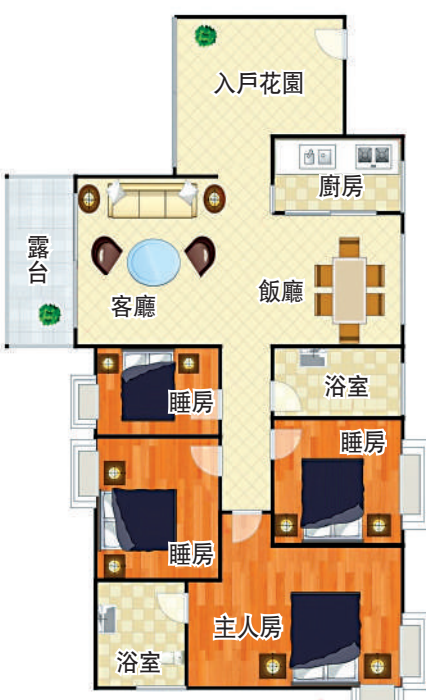
133平米四房兩廳戶型

他透露，目前金域豪庭一、二、三期的市場成交價每平米分別為5萬多、6萬及6.5萬至7萬元；而政府指導價每平米分別為4.7萬、5.19萬及5.8萬元。金域豪庭63平米兩房單位總價不到400萬元，有利港人輕鬆上車。