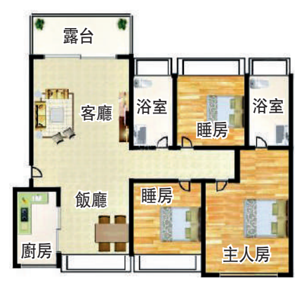
87平米三房兩廳戶型