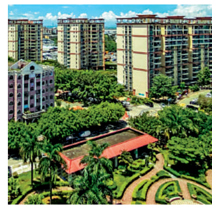
▲金域豪庭作為會展片區優質二手樓盤，因交通出行便利，周邊生活設施充足。