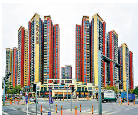
▲中糧鳳凰里花苑小區步行約10分鐘到地鐵11號線橋頭站。

所和橋頭社區健康服務中心；景山實驗學校、橋頭小學、福永中學和深圳第十二高級中學。