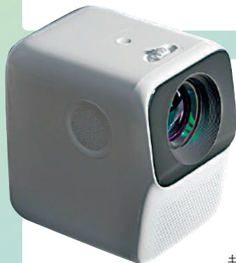
◀ 萬播T2 Max家用投影儀售價親民。

「堅果」投影是國產投影儀品牌中相對廣受好評的，產品也比較過硬的廠家之一。尤其是2021年，堅果推出「堅果智慧牆O1」超短焦投影儀之後，一下子將原本市面上動輒上萬元人民幣的超短焦投影產品的門檻降到了三四千元人民幣，讓更多人可以享受到超短焦的魅力。