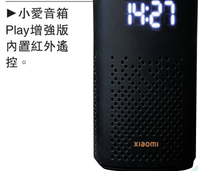
▶ 小愛音箱Play增強版內置紅外線遙控。

想要為自己的小家搭建一套智能家居系統，需要一個智能家居「中心設備」。在小米智能家居生態裏，支持藍牙Mesh網關的智能音箱是個不錯的選擇。從性價比的角度來挑選的話，可以不採用帶屏幕的智能音箱，而選擇性價比高的「小愛音箱Play增強版」。它可以顯示時間，支持藍牙網關，可以控制所有支持藍牙連接的智能家居設備，同時還是一個萬能遙控器。你甚至可以用它來遙控家裏不支持遠程控制、只支持紅外線遙控的電視機、電風扇、空調等家電設備。而它本身還是一個音質不錯的智能音箱，你可以通過對它進行語音操作來直接控制家裏的智能電器，也可以用它播放音樂、聽新聞等。