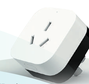
▼ 小米米家空調伴侶。

作為「佛系養生」的單身貴族，我們對室內的空氣質量也有一定的要求，這就離不開一台好用的空氣淨化器了。米家的空氣淨化器不管是從它的淨化能力、外觀設計和可玩性來說，大部分用家都表示滿意。筆者推薦「小米空氣淨化器4 Pro」，它可以有效地過濾空氣中的PM2.5和甲醛、寵物毛髮等，適用於35至60平方米的空間。它耗電量低，工作時噪音小，一個空氣濾芯一般可以使用長達9個月，還可以釋放負離子。