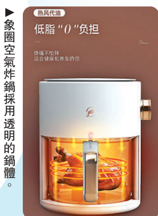
▶ 象圈空氣炸鍋採用透明的鍋體。

「蘇泊爾」的多功能鍋支持：煎、炒、蒸、煮、涮等模式，幾乎涵蓋日常烹飪的所有場景。由於鍋比較深，因此在煎炒和煮湯的時候都不用擔心食物外濺。還可以在煮湯的同時，加上蒸墊，同時烹飪兩道菜品。單身貴族們只要擁有這樣一款鍋，生活中基本上就夠用了。