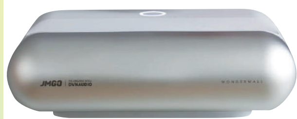
▲ 堅果智慧牆O1超短焦投影儀。

「堅果」投影是國產投影儀品牌中相對廣受好評的，產品也比較過硬的廠家之一。尤其是2021年，堅果推出「堅果智慧牆O1」超短焦投影儀之後，一下子將原本市面上動輒上萬元人民幣的超短焦投影產品的門檻降到了三四千元人民幣，讓更多人可以享受到超短焦的魅力。