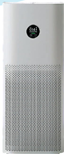
▲ 小米空氣淨化器4 Pro工作時噪音小，耗電量低。

當遇到炎熱的夏季或酷冷的冬季，你回到家的時候，室內溫度已經為你調整到了最舒適的24至25度，這樣的體驗比起到家後打開空調，還要等待很久才能達到舒適溫度的情況，可以說是一種質的提升。而實現這個功能，你只需要一個「空調伴侶」。它的核心還是一個智能插座，但它支持藍牙網關和紅外控制。只要將空調插在上面，就可以實現對空調的遠程操控。你還可以配合米家的藍牙溫度計，設置一些自動化開關的方案。比如溫度低於15度就開啟暖風，溫度高於28度就打開製冷，溫度達到24度後關閉空調等。此外，它還支持實時查看空調功率和統計用電量。這樣既符合單身貴族希望提升生活品質，享受科技帶來的便利，也符合希望過「精明的生活」這個特點。