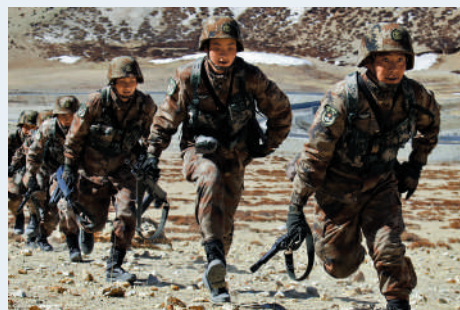
▲駐守西藏阿里軍分區某邊防團聖湖邊防連，開展實戰化課目訓練，提升官兵們在複雜環境遂行多樣化任務能力。