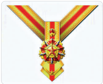
② 紅旗勳章（戰時勳章）