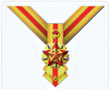
③ 紅星勳章（戰時勳章）