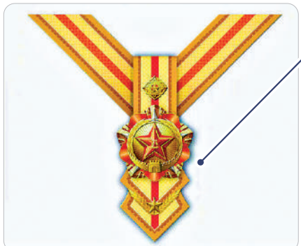
① 八一勳章（軍隊最高榮譽）