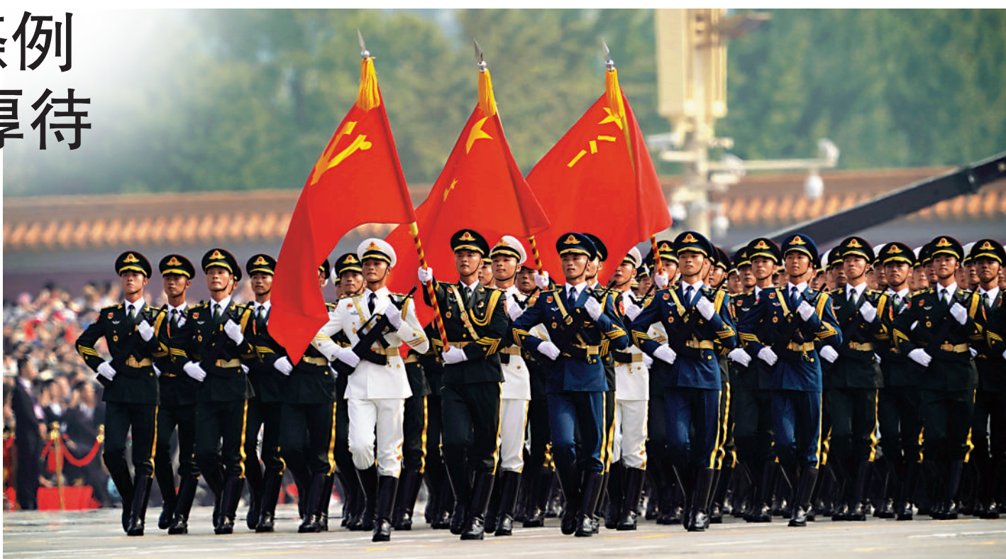
▲《軍隊功勳榮譽表彰條例》日前印發，突出備戰打仗導向，依照「高功重獎、戰功厚待」原則，同級表彰獎勵，戰時待遇高於平時待遇，激勵官兵英勇作戰、奉獻強軍興軍事業。圖為在北京舉行的慶祝中華人民共和國成立70周年大會上，儀仗方隊高擎黨旗國旗軍旗受閱。

《軍隊功勳榮譽表彰條例》在類別項目上，按照規格從高到低，依次設置勳章、榮譽稱號獎章、獎勵獎章、表彰獎章、紀念章等。獎章等區分為戰時、平時、重大非戰爭軍事行動3種實施情形，並按不同類型任務、狀態部隊、崗位人員等進行細化。