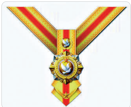
④ 和平勳章（授予外國外軍人員）