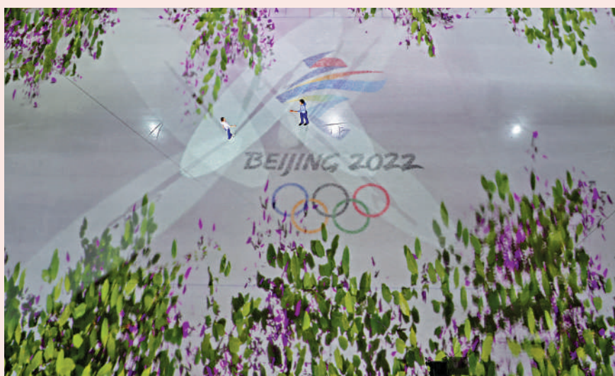
▲無論是開幕式還是比賽場地，北京冬奧會運用科技展現春意。

待到冬奧、冬殘奧謝幕時，賽場外的花園、山野就會春暖花開，春光更加明媚。正如那首雅俗共賞的粵語歌所唱：「好一朵迎春花誰人不愛它，好一朵迎春花迎來大地繡彩霞……」