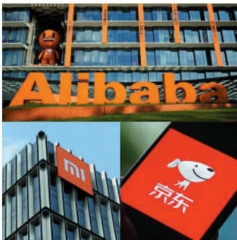
◀阿里、小米和京東等企業捐過億物資助港抗疫。