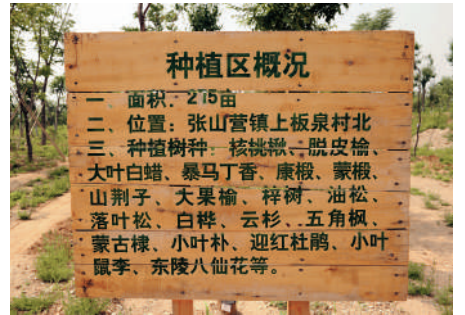
延慶賽區建設時，從海陀山移栽到張家口賽區的樹木。

「小海陀山遷地移植喬木二萬四千餘株，成活率很高，環境保護做得很好。在採訪時，「XCXQ-MGL-008」的編號讓我印象最深，「XCXQ」代表雪車雪橇，「MGL」是指蒙古櫟，合起來的意思是說這棵蒙古櫟是在建設雪車雪橇賽道時移植的第八號樹。」孫晶岩介紹，這是科學細緻的專業記錄檔案方法，它們最終實現了原土、原地、原樣回填，高山植被又重新回到小海陀山。而毋庸多言，僅這一個細節就足以看出中國對「綠色辦奧」的重視。