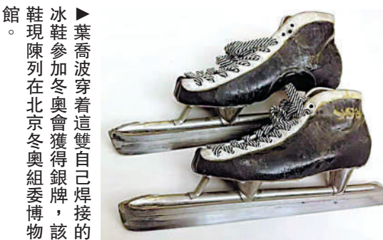
葉喬波參加冬奧會獲得銀牌，該鞋現陳列在北京冬奧組委博物館。