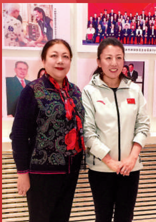
孫晶岩採訪中國首枚冬奧金牌獲得者楊揚（右）。