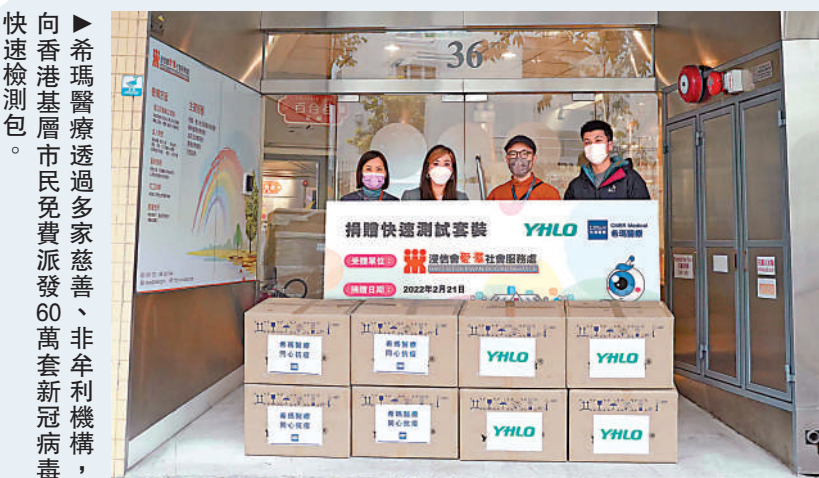
希瑪醫療透過多家慈善、非牟利機構，向香港基層市民免費派發60萬套新冠病毒快速檢測包。

港區全國人大代表、立法會選委會界別議員、希瑪醫療主席兼行政總裁林順潮表示，承諾向基層市民捐出30萬套新冠病毒快速檢測包後，短短數日內捐贈數量已超額爆滿。為了讓更多有需要的基層市民獲得檢測包，決定加捐至60萬套，盡最大能力紓緩現時快速測試包供不應求的壓力。