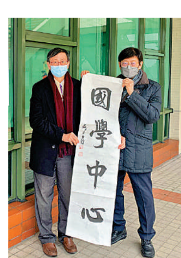
教大成立國學中心，在香港及大灣區其他地區開展中華傳統文化課程及教研項目，推動國學發展。