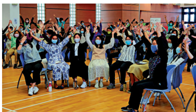
工作坊以「先遊戲，後講解」模式進行，老師互動參與，與不同幼稚園的同行交流分享。