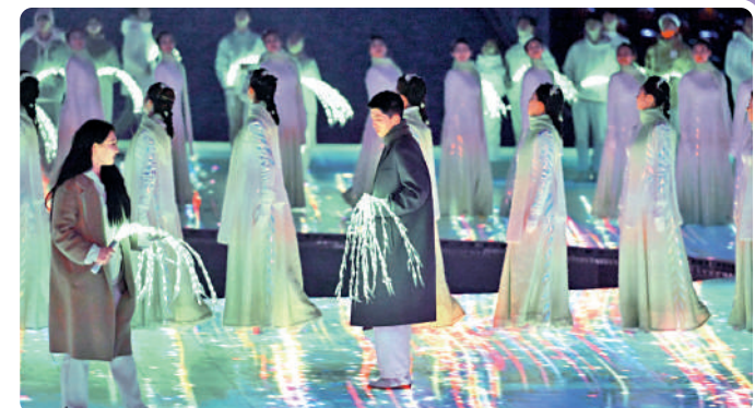
▲在北京冬奧會閉幕式上，「折柳寄情」的巧妙構思令觀眾讚嘆。