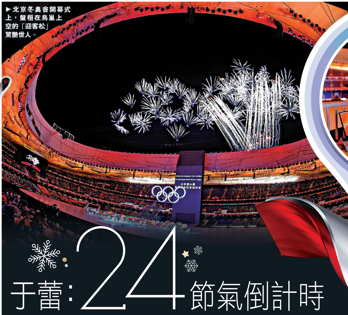
▶北京冬奧會開幕式上，盤桓在鳥巢上空「迎客松」驚艷世人。