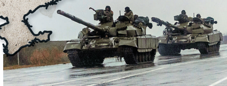
▲烏克蘭坦克24日在馬里烏波爾街頭行進。