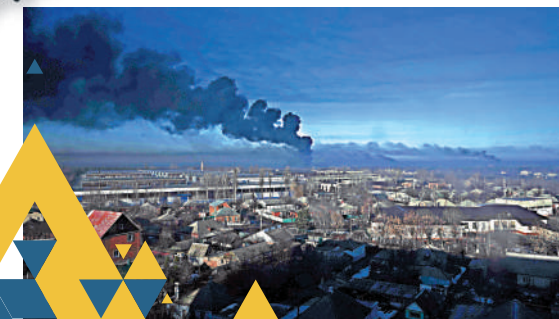
▲哈爾科夫附近一個軍用機場24日遭空襲。