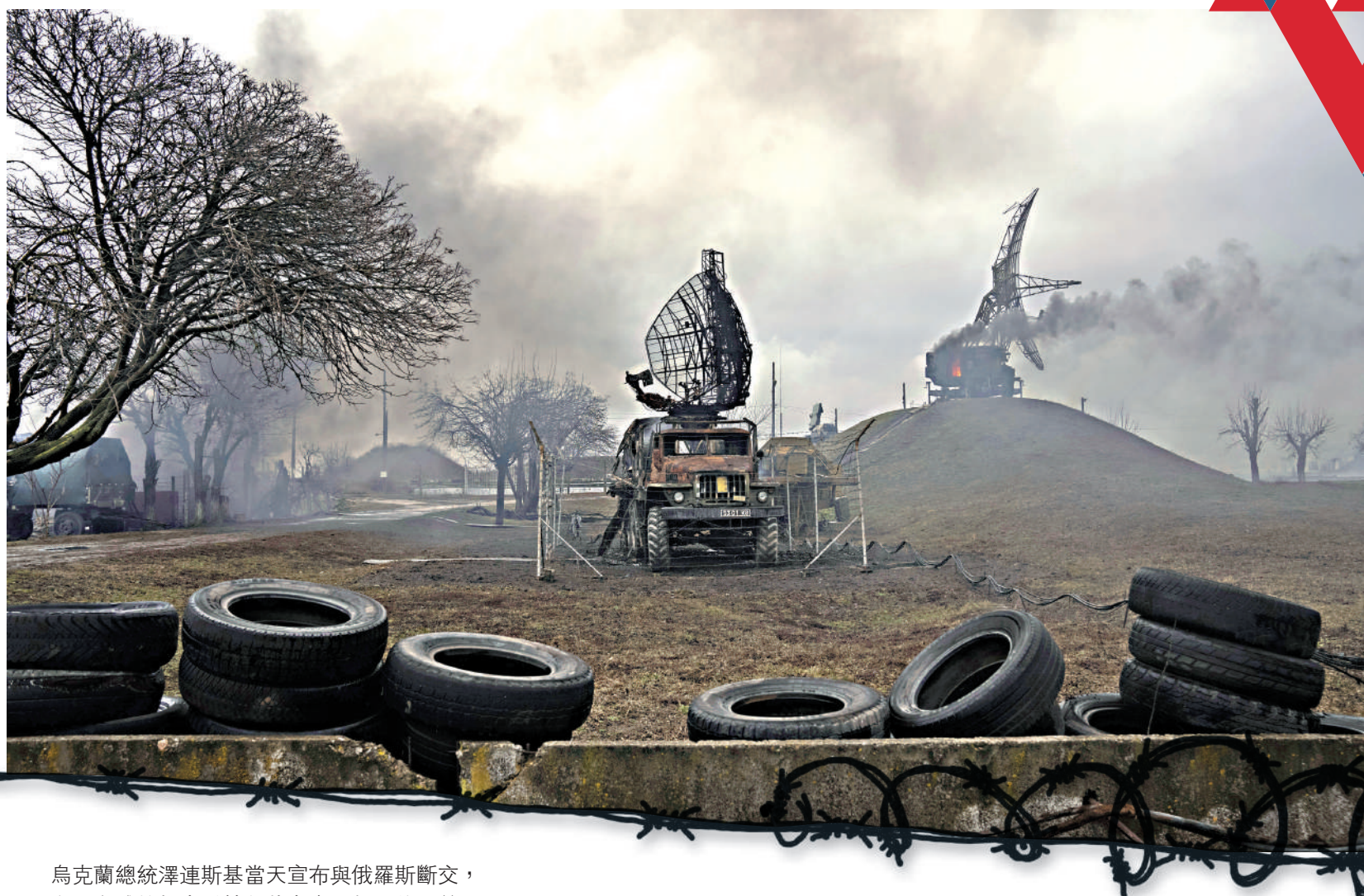
俄軍轟炸馬里烏波爾一處軍事設施，破壞雷達和其他設備。美聯社

【大公報訊】綜合《紐約時報》、美聯社、路透社報導：俄羅斯總統普京當地時間24日清晨發表電視講話稱，決定在烏克蘭東部頓巴斯地區發起「特別軍事行動」。隨即，俄羅斯海陸空三軍出動，從三個方向進入烏克蘭，對多個城市的軍事設施和軍用機場進行打擊。本港時間24日晚，俄烏兩軍爭奪基輔北郊的一處軍事基地，爆發激烈交火；甚至烏克蘭北部的切爾諾貝爾也傳出槍聲。烏克蘭發出防空警報，通知所有人前往防空避難所。CNN指烏克蘭全國已有數百人傷亡，其中至少40人死亡。