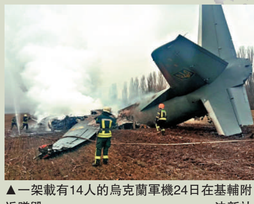
▲一架載有14人的烏克蘭軍機24日在基輔附近墜毀。