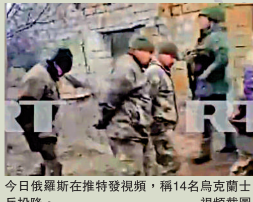
今日俄羅斯在推特發視頻，稱14名烏克蘭士兵投降。視頻截圖