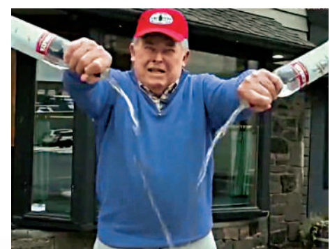
▲美國網友發起「傾倒伏特加」活動。

羅斯產品。西弗吉尼亞州州長賈斯蒂斯同日下令，禁止在該州購買和銷售俄羅斯酒，並要求零售商將幾款伏特加酒下架。美國和歐洲的部分零售商早已下架Smirnoff和Stolichnaya等伏特加品牌，以聲援烏克蘭，但這些品牌其實與俄羅斯並無關係。