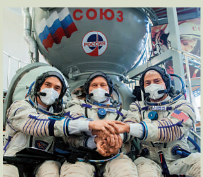
▲去年3月，俄羅斯與美國航天員在國際空間站合影。

總署(NASA)在「Venera-D」金星探測任務上的合作，相關發射工作原定2029年展開。此外，美國的多款火箭都採用俄製引擎，若俄方對美方限售，美國軍用衛星、太空站補給、太空人輪換等任務都將受到影響。