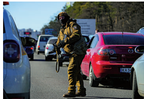
▲2月28日，烏克蘭士兵在基輔一處關口檢查過往車輛。

現在，哈爾科夫已進入全天宵禁狀態，烏克蘭軍隊已警告當地民眾，在宵禁期間外出，隨時可能會面臨被擊斃的風險。