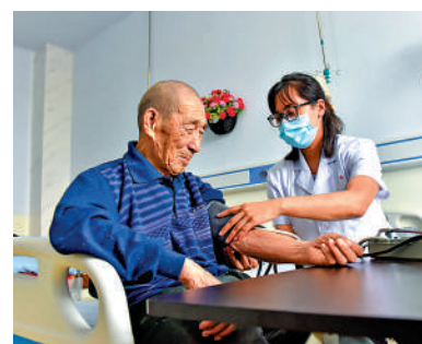
2021年5月25日，河北省邢台市南和區三思鎮衛生院醫養中心醫務人員為老人測量血壓。