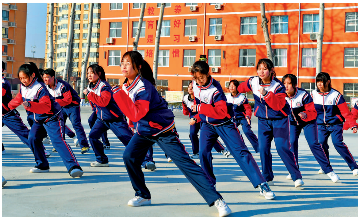
去年12月28日，河北省雄安新区雄縣第一初級實驗中學的學生練習冰雪健身操（滑冰動作）。