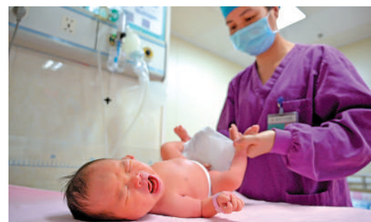
醫院護士為新生兒進行體格檢查。

研中發現，影響「三孩」政策落地的因素有很多，比如婚育生育觀念的改變、養育子女的成本逐年抬升、父母難以平衡家庭與工作的關係，等等。據此，今年全國兩會，他將提交關於完善配套體系、促進「三孩」政策落地的建議，如推出生育獎勵，加大減稅力度，給予各類補貼，實施優待政策等。 全國人大代表盧馨建議，適當提高個人所得稅專項附加扣除額，適當延長男性育兒假並建立靈活的休假制度，有條件的單位針對本單位女職工0-3歲的幼兒建立託育場所。她認為，適當延長男性陪產育兒假並實施靈活休假，是一個行之有效的辦法。