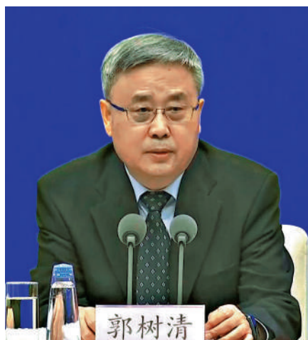
▲中國銀保監會主席郭樹清表示，已反覆提醒大型銀行注意房貸風險。

【大公報訊】中國去年樓價下調，房地產泡沫化勢頭扭轉。國務院新聞辦公室昨舉行「促進經濟金融良性循環和高質量發展」相關主題的新聞發布會，中國銀行保險監督管理委員會主席郭樹清表示，現在房地產價格有一些調整，需求方面結構產生一些變化，對金融業來說是一件好事，但是不希望調整得太劇烈，對經濟影響得太大，還是要平穩的轉換。