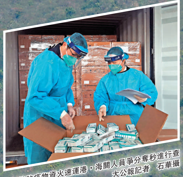
▲大批防疫物資火速運港，海關人員爭分奪秒進行查驗。