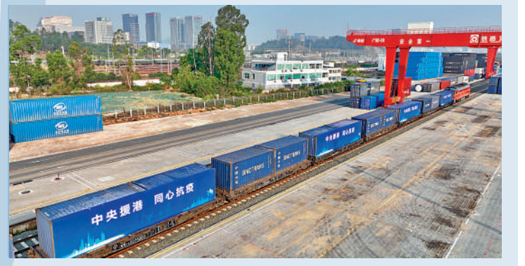
▲首趟班列裝載了大量防疫物資，包括檢測試劑、防護服及其他醫療用品等；車身印有「中央援港 同心抗疫」標語，滿載中央及全國人民對香港的關愛。

林鄭月娥率多位特區官員昨日迎接首趟鐵路援港班列。她表示，鐵路援港班列將保障香港在嚴峻的新冠肺炎疫情下，物品、食品供應穩定。她提到，上世紀60年代，在周恩來總理的關心下，開創了每日「定期、定班、定點」的「三趟快車」，照顧了香港同胞的生活需要。現在，在香港嚴峻的新冠肺炎疫情下，鐵路援港班列開通，更是體現了中央對香港的關愛和支持。