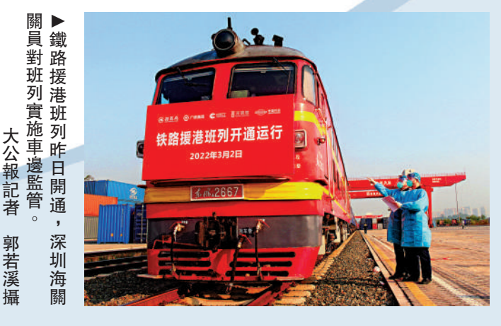
關員對班列實施車邊監管。大公報記者 郭若溪攝