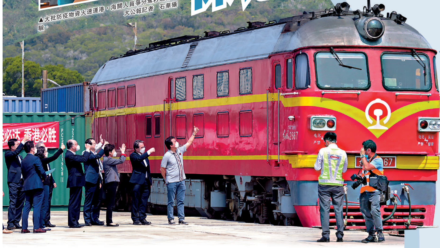
▲內地首班鐵路援港班列昨日到港，特首林鄭月娥與運房局長陳帆一行在羅湖站迎接。