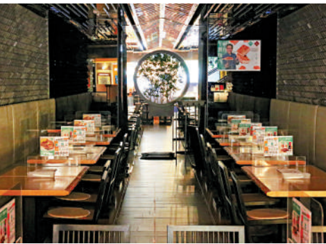
▲飲食業累計逾3000間食肆停業，佔全港食肆的五成以上。