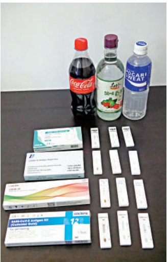
▲大公報記者昨日在深水埗街頭隨機購買四款快速測試套裝進行實測。

結果發現，四個品牌均對可樂出現「兩條線」的反應，但「兩條線」顏色偏淡。若用白醋，沒出現紅線。若用寶礦力水特，GOLDSITE的測試反應是清晰在C及T位置出現紅線。