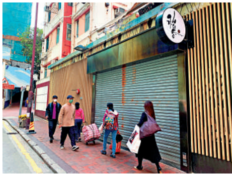
▲尖沙咀稻香酒家已經暫停營業。