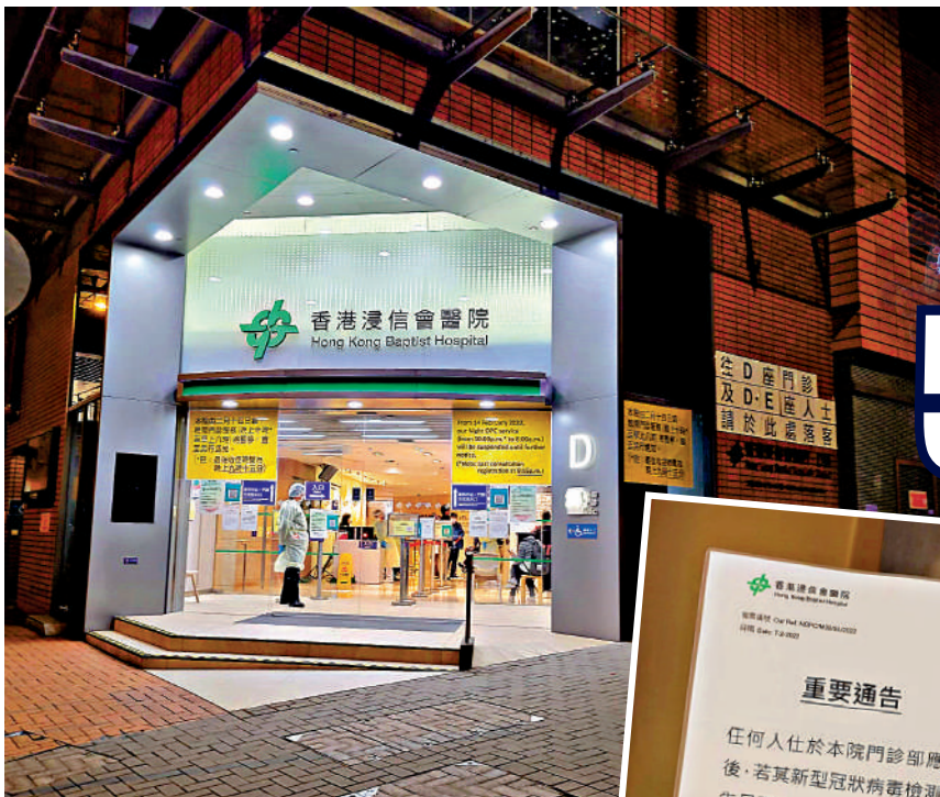
▲有私家醫院在大門貼出通告，表示若求診者新冠病毒檢測報告呈陽性，將會即時向衛生防護中心呈報並轉送病人至公立醫院急症室。

本港昨日新冠肺炎確診人數再破頂，首次單日突破五萬宗，錄得新增55353宗確診，並再有多名患者離世。疫情危急，公共醫療瀕臨崩潰，但私家醫院一直未協助接收新冠確診患者。 有公立醫院醫生報料，私家醫院「趁火打劫」，向確診患者報稱負壓病房每日收費8萬至10萬元，病人被天價收費嚇退，結果被轉介到公立醫院治療。 醫院管理局證實，有約60名私院病人，因快速測試驗出陽性，被轉至公院醫治。專家認為，私院只要與醫管局一樣採取感染控制措施，有能力協助處理新冠輕症門診及住院病人。 大公報記者 王亞毛