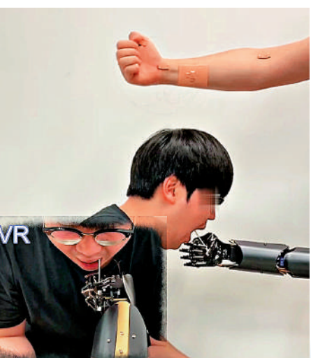
實驗參與者遙控機械手作深喉唾液採樣以檢測新冠病毒。