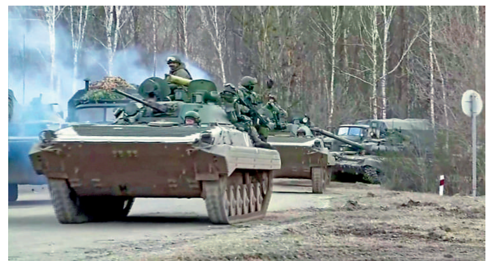
▲俄羅斯坦克3日向基輔地區進發。

扎波羅熱核電站發言人圖茲4日凌晨表示，有炮彈直接落入核電站廠區內，造成1號核電機組和一座5層高的行政培訓大樓起火。據悉，1號核電機組正進行翻修並未運轉，但其中有核燃料。但烏克蘭緊急部門官員當天上午談及大火被撲滅時，僅提及培訓大樓起火，稱核電站「關鍵設施」未受影響。國際原子能機構（IAEA）4日表示，烏克蘭監管部門通報核電站周邊輻射數值並未發生變化。IAEA主席格羅斯表示，他將立即前往切爾諾貝爾，與俄烏雙方進行協商，防止再次發生核電站因武裝衝突受損的情況。美國能源部長格蘭霍姆稱，並沒有監測到核電站附近的輻射讀數升高，反應堆受到堅固安全殼的保護，正在安全關閉。