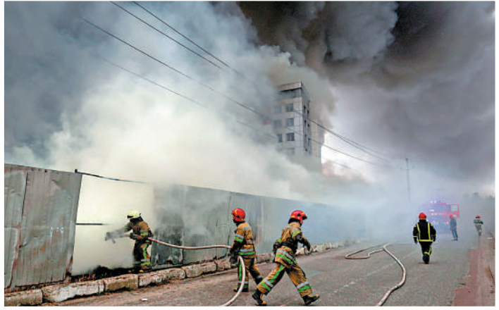
▶ 消防員3日在基輔郊外一個倉庫救火。

中國外交部發言人汪文斌4日表示，美方近來一再散布虛假訊息，借烏克蘭問題對中國進行污蔑抹黑，暴露了美方借危機漁利的真實意圖。中方呼籲有關各方保持冷靜克制，防止局勢進一步升級，確保有關核設施的安全。此外，針對社交媒體上流傳的「兩名中國留學生在哈爾科夫文化學院宿舍遭炮擊身亡」的消息，中國駐烏克蘭大使館闢謠稱，經核實，該學校沒有這兩名中國留學生。