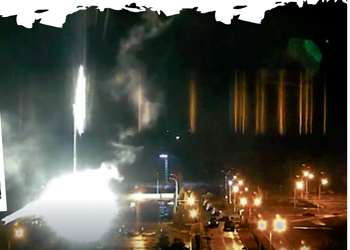
▲視頻畫面顯示，烏克蘭扎波羅熱核電站4日凌晨起火。