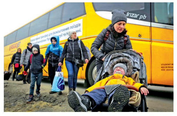
▲ 烏克蘭一名推着嬰兒車的婦女4日抵達波蘭梅迪卡邊境口岸。

賴俄羅斯。印媒2日報導，有美國外交官透露，拜登政府正在考慮是否就印度從俄羅斯購買S-400防空導彈系統，對印度發起制裁。阿聯酋總統顧問加爾加什2月27日稱，阿聯酋「認為選邊站只會導致更多暴力」，阿聯酋的首要任務是「鼓勵各方訴諸外交行動」。《紐時》稱，在整個亞太地區，只有日本、新加坡、韓國和澳洲4國同意對俄羅斯發起國際制裁。