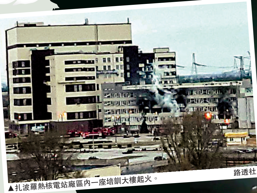
▲扎波羅熱核電站廠區內一座培訓大樓起火。路透社

【大公報訊】綜合美聯社、路透社、俄羅斯衛星通訊社報導：位於烏克蘭南部的歐洲最大核電站扎波羅熱核電站區域內4日凌晨遭炮擊一度起火，俄軍隨後完全控制該核電站。國際原子能機構確認，扎波羅熱核電站的輻射水平沒有變化，火災也未影響核電站的基本設備。對於這一影響全球安全的重大襲擊，俄烏互相指責是對方所為。烏總統澤連斯基指俄方詭辯「核恐怖主義」，想讓切爾諾貝爾核災「重演」。俄國防部則表示，烏方一個「破壞小組」對核電站發動了攻擊。