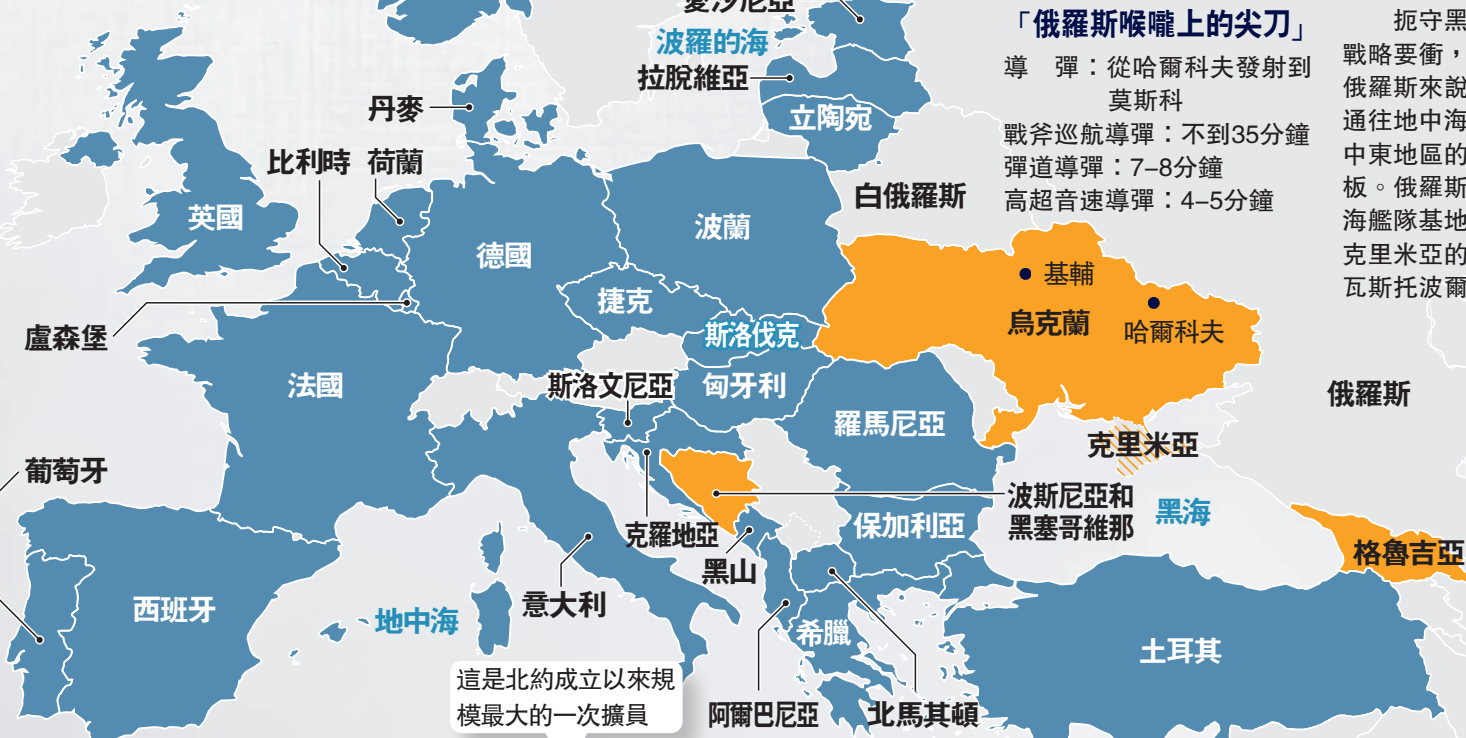
北約五次東擴時間

1999年 ● 波蘭 ● 捷克 ● 匈牙利 2004年 ● 愛沙尼亞 ● 拉脫維亞 ● 立陶宛 ● 斯洛伐克 ● 斯洛文尼亞 ● 羅馬尼亞 ● 保加利亞 2009年 ● 克羅地亞 ● 阿爾巴尼亞 2017年 ● 黑山 2020年 ● 北馬其頓