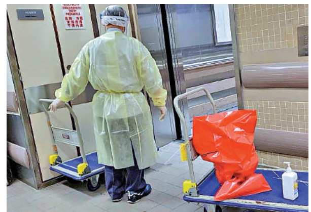
據了解，紅色膠袋裝載感染新冠病毒患者用過的棄置醫療垃圾，以及醫護人員穿戴過的防護裝備。