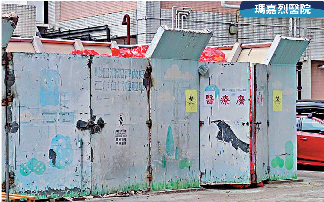
瑪嘉烈醫院垃圾房爆滿，室外的醫療廢物倉堆滿紅色膠袋。