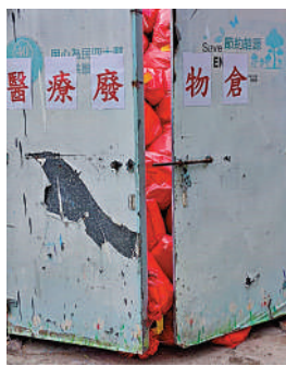
瑪嘉烈醫院醫療廢物倉堆滿垃圾袋，鐵板門也不能合上。

醫院管理局總行政經理（綜合臨床服務）李立業醫生昨日在疫情記者會上表示，因過去數周入院患者增加，員工正努力並用盡方法清理這些醫療廢物，但垃圾量是數以倍計。目前有關部門以既定機制處理，即由合資格的收集承辦商來處理。當局已委託承辦商加快處理廢物，亦額外增派承辦商處理積壓的廢物，另外亦加裝了設施，加大可處理醫療廢物的容量，並會與承辦商緊密溝通，希望可加快處理廢物。