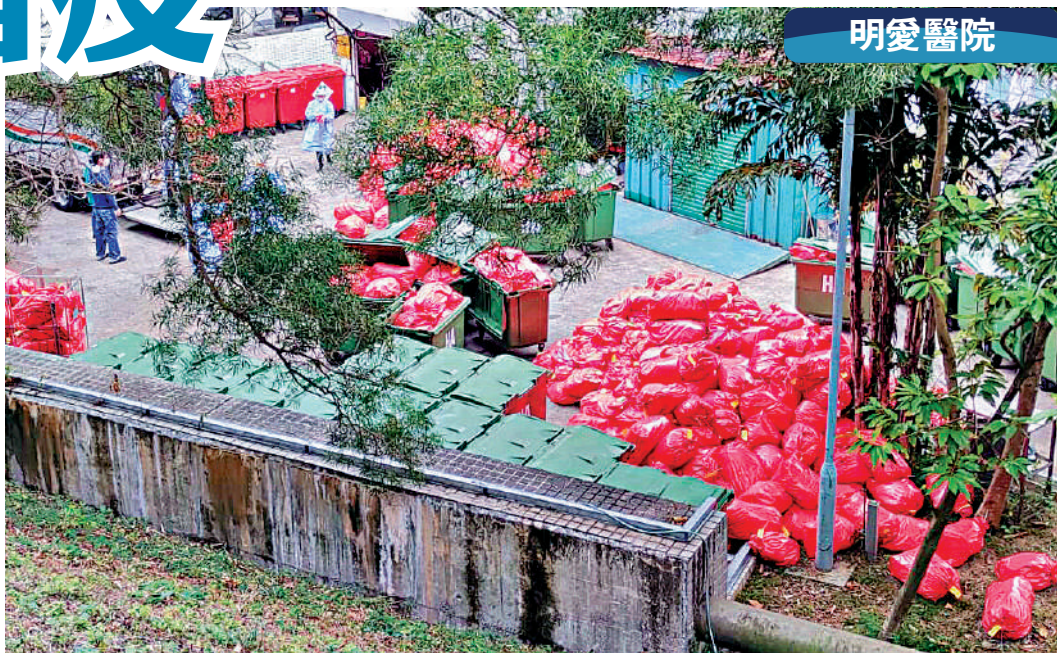
明愛醫院懷信樓後的垃圾站，紅色膠袋堆積如山，內裏裝滿醫療廢物。